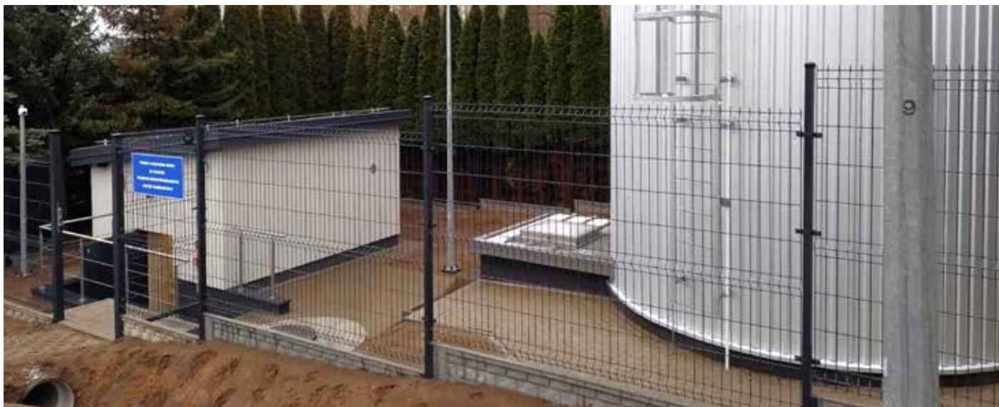
Przepompownia wody w Zosinie