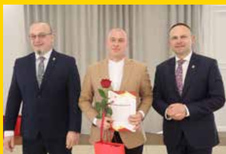
Dzień Sołtysa str. 11