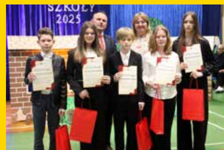
Stypendia dla najlepszych uczniów Gminy Łomża str. 14-16