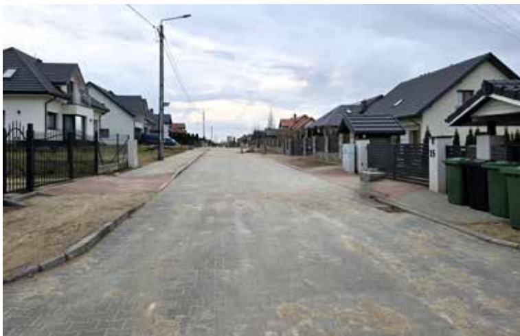
Janowo, ul. Lawendowa

W tym roku oświetlenia uliczne dobudowano już w Jarnutach, Lutostani, Modzelach-Wypychach a niebawem zostanie zbudowane także na ul. Słonecznej w Wygodzie.