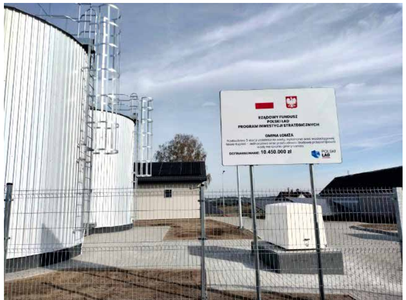
Stacja uzdatniania wody w Siemieniu Nadrzecznym

było duże ryzyko, bo kilka miesięcy wcześniej Rosja zaatakowała Ukrainę, a w Polsce ceny poszybowały w górę, musieliśmy się tego podjąć, bo SUW w Nowych Kupiskach i Siemieniu Nadrzecznym, które powstały w latach 1975