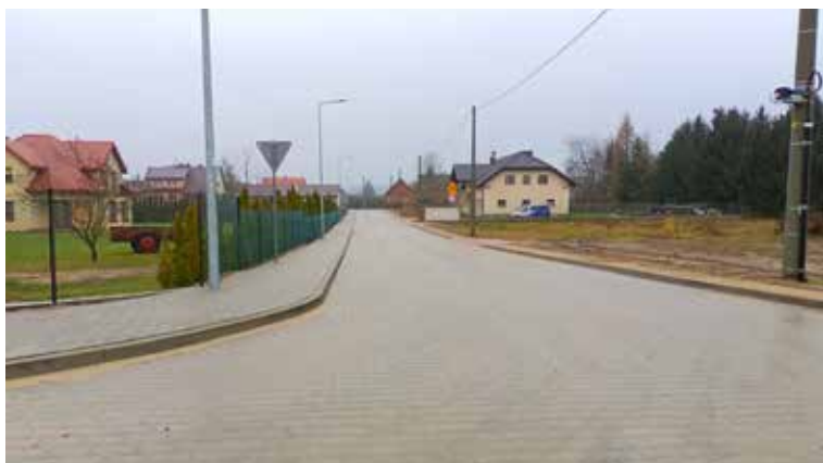
Podgórze, ul. Słoneczna