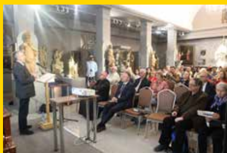
1000 lat temu w Królestwie Polskim str. 8-9