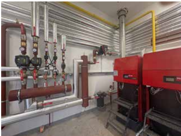
Kotłownia w SP w Konarzycach

Równocześnie prowadzone są roboty przy remoncie sali gimnastycznej oraz łazienek w budynku SP w Wygodzie. W tej samej szkole inny wykonawca, po zakończeniu sezonu grzewczego, wykona przebudowę kotłowni. Stary