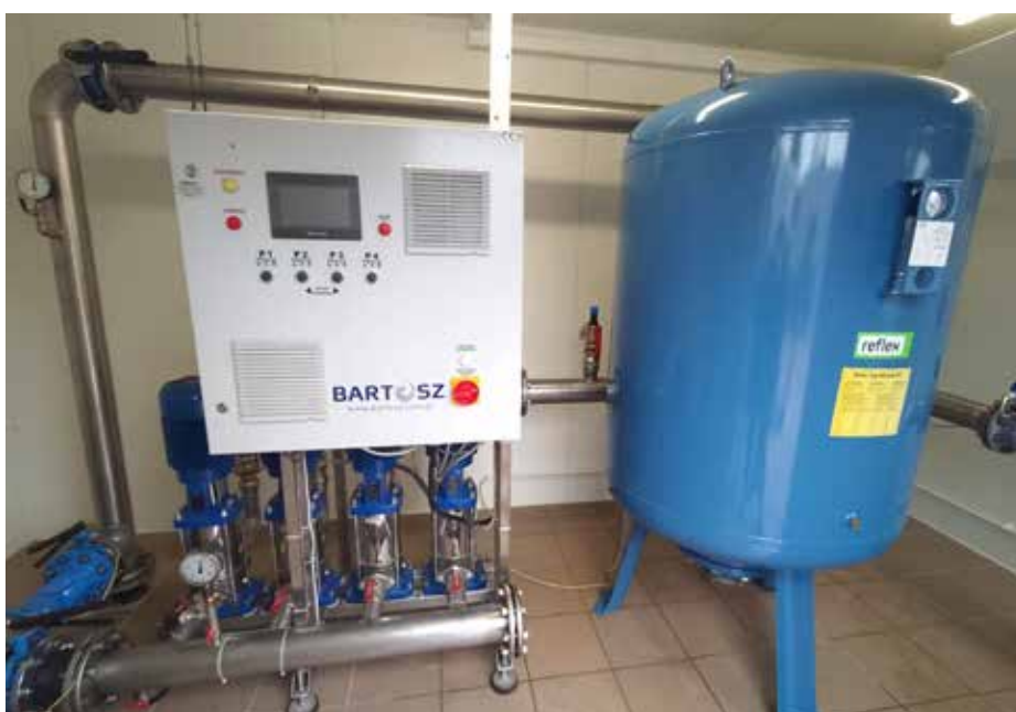
Przepompownia wody w Konarzycach

i 1976 były już na skraju możliwości dalszego funkcjonowania.