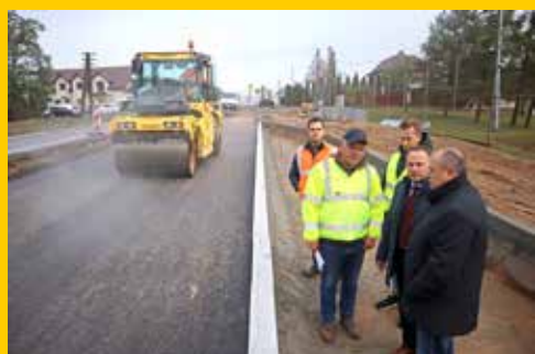
Budżet gminy 2024 s. 4-5