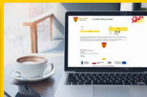
E-urząd Gminy Łomża s. 16