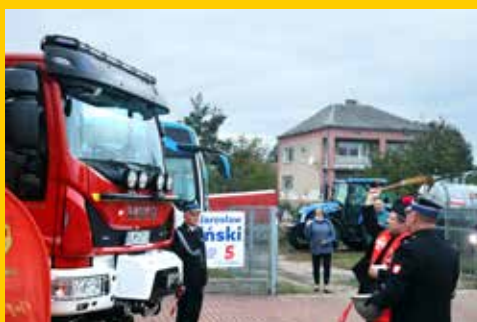
Nowe wozy dla OSP s. 14-15