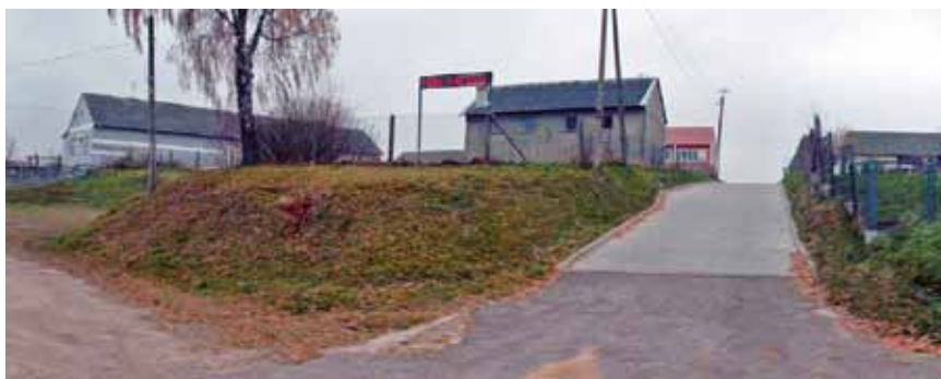
Siemień Nadrzeczny SUW