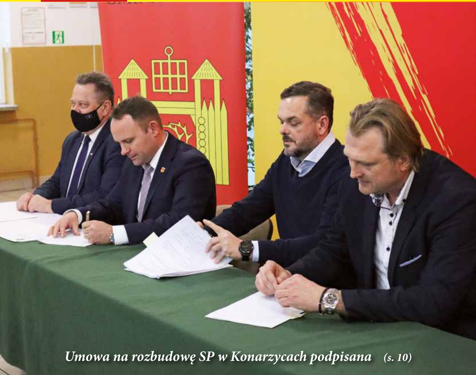
Umowa na rozbudowę SP w Konarzycach podpisana (s. 10)