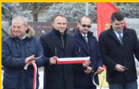
Otwarcie ulicy Akacjowej w Pniewie (s. 10-11)