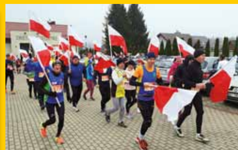
Zakończyła się 1 edycja „Aktywnej Piątki Gminy Łomża” (s. 18-19)