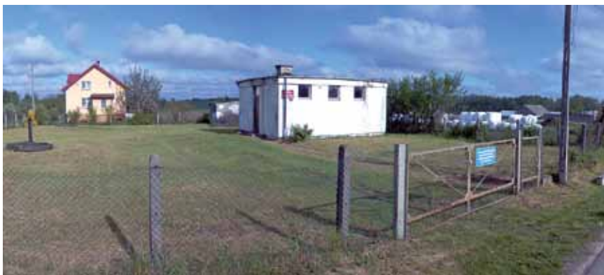
Nowe Kupiski SUW

Rządowy Fundusz Polski Ład to Program Inwestycji Strategicznych, który ma na celu zwiększenie skali inwestycji publicznych przez bezzwrotne dofinansowanie inwestycji realizowanych przez JST. Program realizowany będzie poprzez promesy inwestycyjne udzielane przez Bank Gospodarstwa Krajowego.