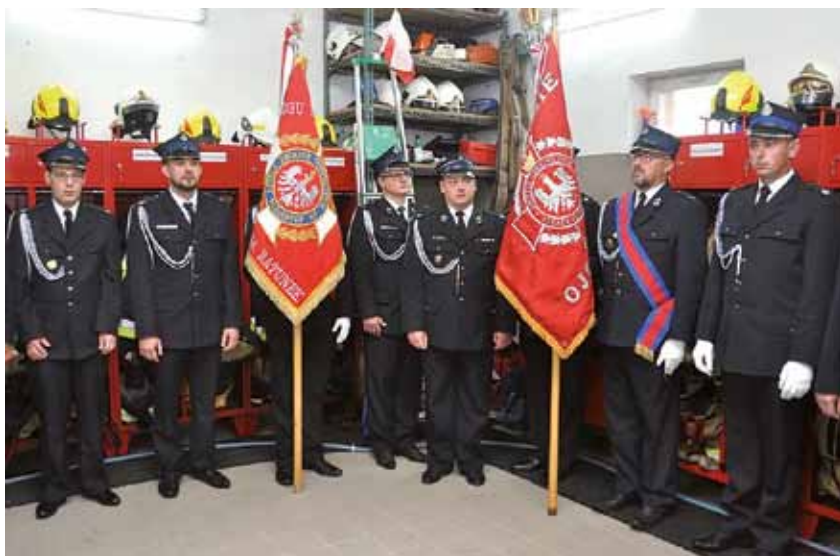
Strażacy OSP Gminy Łomża