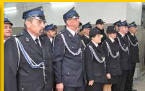
Dzień Strażaka (s. 8-9)