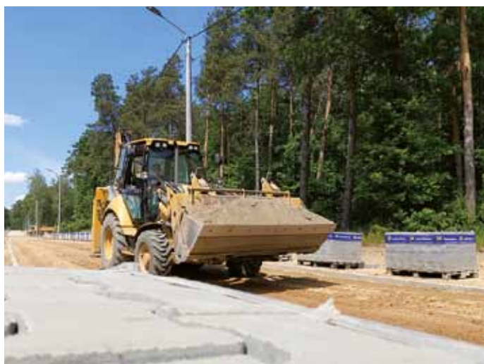
Budowa ul. Zielonej i Piaskowej w Jednaczewie

Ulica Szkolna w Jednaczewie z jezdnią o szerokości 6 m, zostanie wykonana z masy bitumicznej, natomiast ulice Zielona i Piaskowa będą miały po 5 m szerokości i zostaną zbudowane z kostki brukowej. W ramach inwestycji przebudowane zostaną także dwa skrzyżowania ulic.