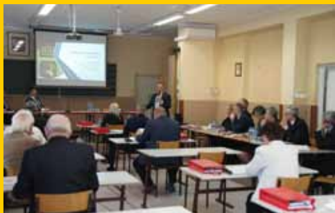
Jednoglębne absolutorium od radnych (s. 3)