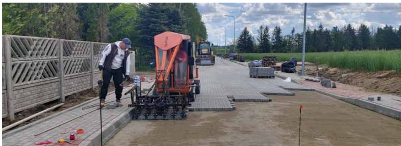
Budowa ul. Ogrodowej w Konarzycach

– To pierwszy etap tej inwestycji. Zaczniemy budowę od strony Zosina. Chcemy teraz zbudować blisko 800 metrów ulicy z pełnym jej uzbrojeniem – mówi Wójt Gminy Łomża Piotr Kłys. – Koszt budowy tego odcinka szacowany jest na ok. 3 mln 175 tys. zł, a pozyskane środki zewnętrzne to blisko 1 mln 600 tys. zł. Budowa ul. Wiejskiej zacznie się jeszcze w tym roku,