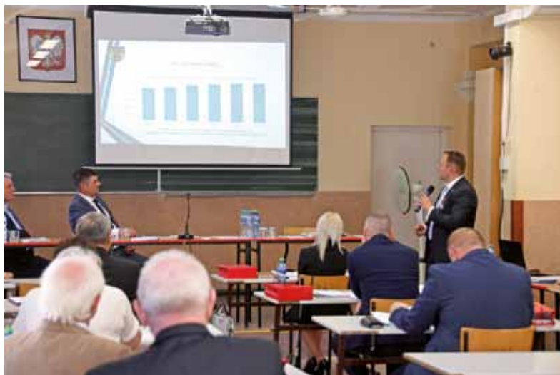
Wójt prezentuje Raport o stanie Gminy Łomża za 2020 r.

w sektorze prywatnym. To o 70 więcej niż notowano na koniec 2019 r. Zdecydowana większość, ponad 90% z nich to tzw. osoby fizyczne prowadzące działalność gospodarczą i mikroprzedsiębiorstwa zatrudniające do 9 osób. To te działalności najlepiej świadczą o aktywności mieszkańców.