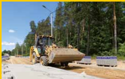
Miliony na drogi (s. 4-5)