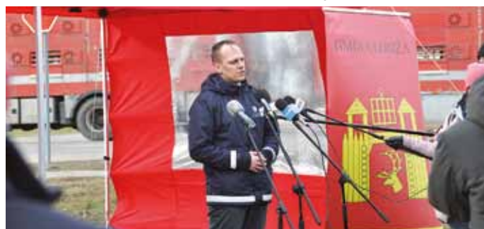
Rafał Weber, Wiceminister Infrastruktury