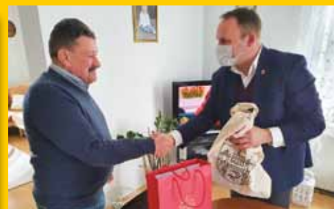
Dzień Sołtysa (s. 9)