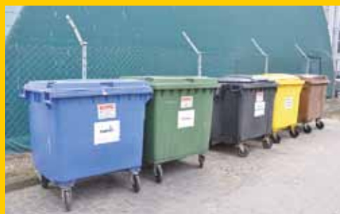
Nowe zasady wnoszenia opłat za śmieci (s. 4)