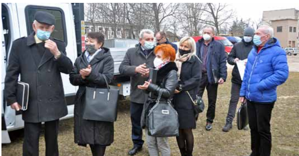
Radni Gminy Łomża