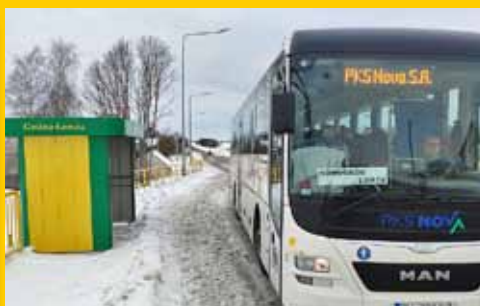
„Niebieska linia” autobusowa w Gminie Łomża (s. 6-7)