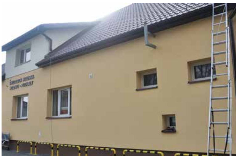
Świetlica wiejska w Puchałach