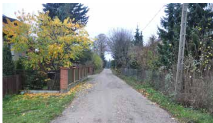
ul. Ogrodowa w Konarzycach