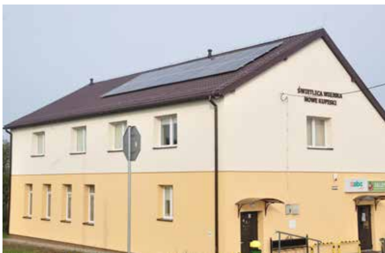
Świetlica wiejska w Nowych Kupiskach