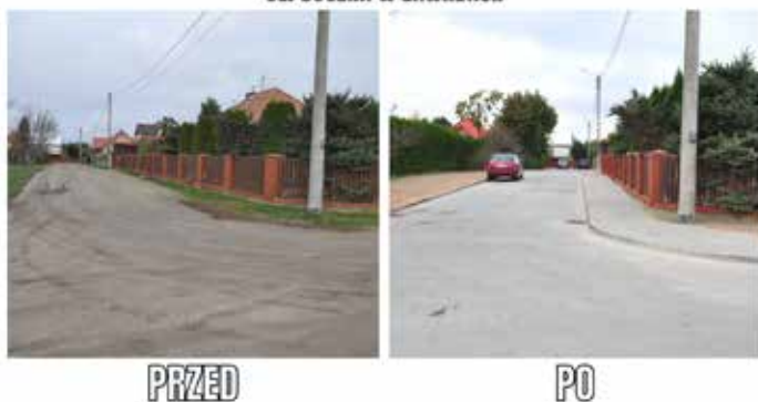
UL. BOCZNA W ZAWADACH