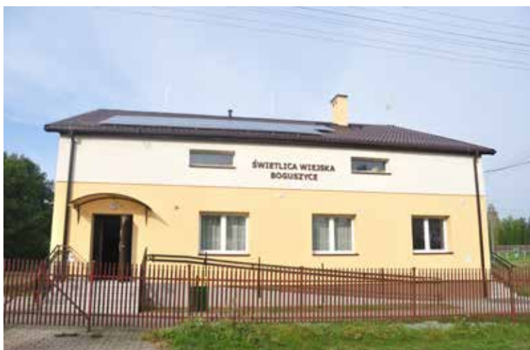
Świetlica wiejska w Boguszyce

Świetlice wiejskie w Boguszycach, Nowych Kupiskach i Puchałach przeszły gruntowną termomodernizację. Zyskały nowy wygląd, ale także nowoczesne instalacje fotowoltaiczne i ogrzewanie w oparciu o pompy ciepła. Na realizację zadania Gmina Łomża pozyskała ponad 1,3 mln zł dofinansowania.