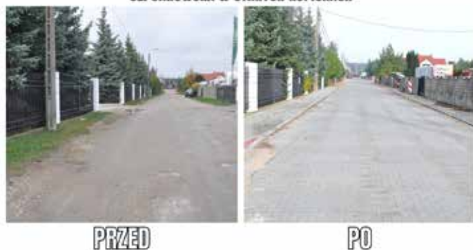
UL. JANOWSKA W STARYCH KUPISKACH