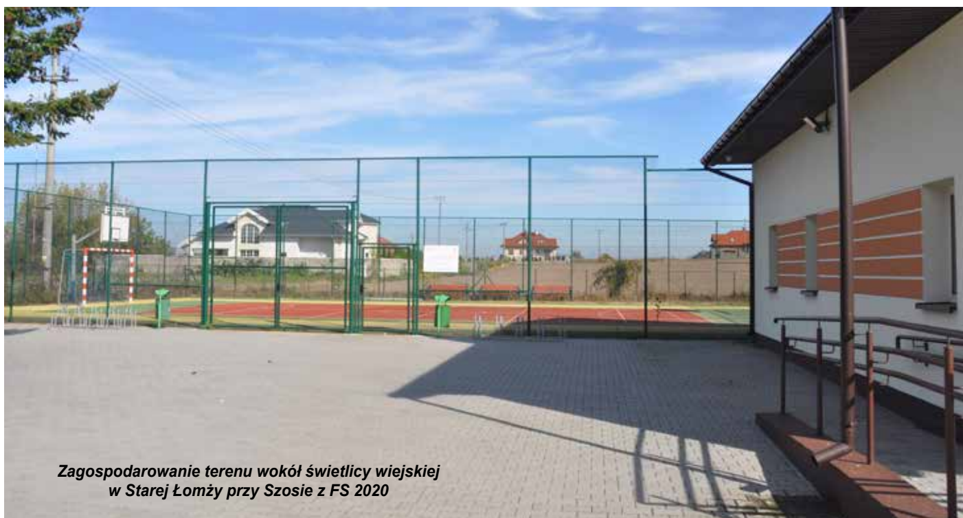
Zagospodarowanie terenu wokół świetlicy wiejskiej w Starej Łomży przy Szosie z FS 2020

Mieszkańcy przeznaczyli też środki finansowe w kwocie ok. 60 tysięcy złotych na szkoły podstawowe. Dzięki nim zostanie wyremontowany korytarz, zakupione wyposażenie i futryny do drzwi w SP Puchałach. Szkoła w Podgórzu zyska nowy instrument muzyczny z osprzętem, a szkoła w Konarzycach ciągniczek do koszenia trawy. Wyposażona zostanie także świetlica znajdująca się pod salą gimnastyczną szkoły w Jarnutach.