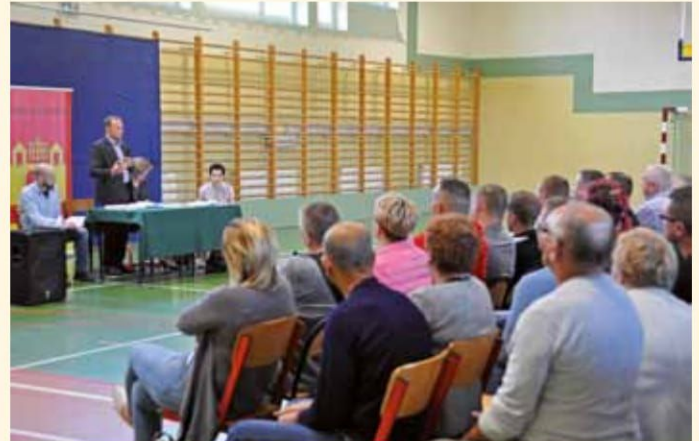
Spotkanie z beneficjentami projektu

Na spotkaniu z zainteresowanym mieszkańcom – uczestnikom wspólnego projektu – przekazano informacje dotyczące cen instalacji po ogłoszonym przez Urząd Gminy przetargu, a także aktualnej interpretacji Ministerstwa Finansów dotyczącej konieczności pokrycia podatku VAT od przyznanej dotacji. W związku z tym wkład własny mieszkańca oraz Gminy na realizację projektu musiałyby znacząco wzrosnąć. Licznie zgromadzeni mieszkańcy, po dyskusji oraz analizie kosztów, w dużej części zrezygnowali z udziału w projekcie. Konsekwencją jest niemożliwość dalszej realizacji projektu, gdyż prowadzi to do nie osiągnięcia zakładanych wskaźników