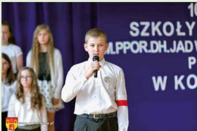
Występy uczniów Szkoły Podstawowej w Konarzycach