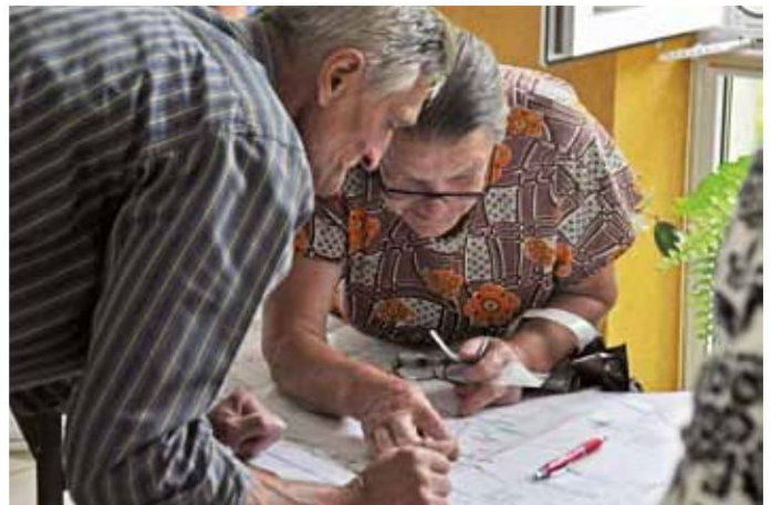
Zainteresowani w trakcie spotkania mogli uzyskać szczegółowe informacje dotyczące obwodnicy Konarzyc

przybędzie rzeczoznawca, aby ustalić stan działki w dniu wydania tej decyzji, to w możliwie dokładny sposób zinventaryzować wszystko, co na niej jest. Może się zdarzyć, że rzeczoznawca nie zdąży przybyć na działkę, a wykonawca rozpocznie roboty budowlane i – aby uniknąć nieporozumień dotyczących wysokości odszkodowania – najlepiej dysponować własną dokumentacją fotograficzną, inwentaryzacją lub tp.