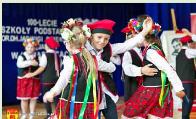
Występy uczniów Szkoły Podstawowej w Konarzycach