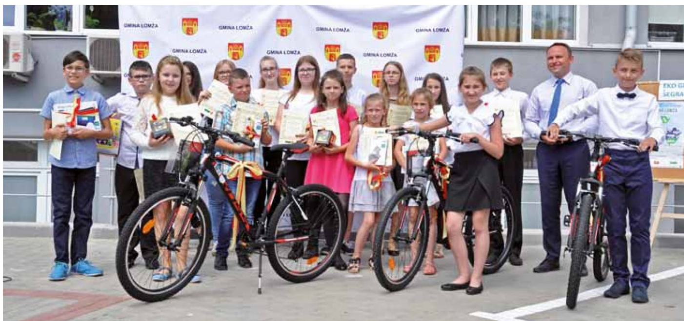
Nagrodami dla laureatów konkursu były rowery i sprzęt elektroniczny

– Dbanie o środowisko jest bardzo ważne, bo to od nas zależy w jakim miejscu będziemy żyć – mówi Wójt Gminy Łomża – Zorganizowany konkurs jest świetną promocją ekologicznych zachowań. Zależało nam, aby zwycięzcy konkursu otrzymali nagrody, które zmotywują ich do wyruszenia w podróż po gminie i nie tylko. Nie zapominajmy o tym, że przecież należymy do zielonych Płuc Polski i mamy wiele pięknych miejsc do odkrycia, do czego zachęcam wszystkich mieszkańców.