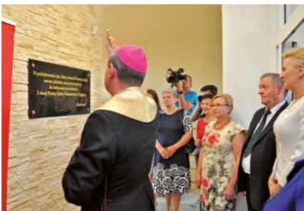
Oficjalne odsłonięcie i poświęcenie tablicy pamiątkowej