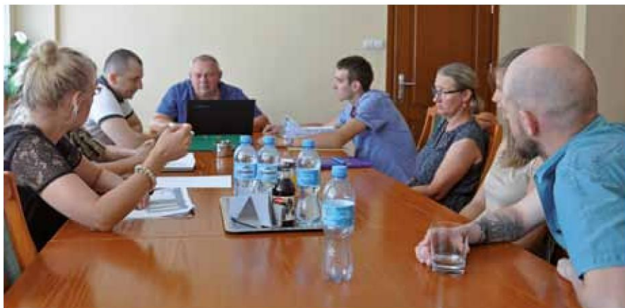
Spotkanie pracowników Urzędu Gminy z przedstawicielami Ośrodka Doradztwa Rolniczego

Straty spowodowane przez tegoroczną suszę na terenie gminy Łomża objęły blisko 4 tysiące hektarów gruntów ornych i łąk. Susza dotknęła głównie zboża jare, drugi pokos trwałych użytków zielonych i kukurydzę.