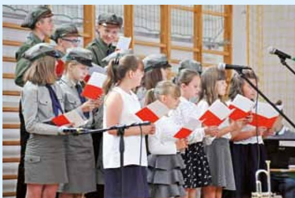
Część artystyczna w wykonaniu uczniów Szkoły Podstawowej w Wygodzie