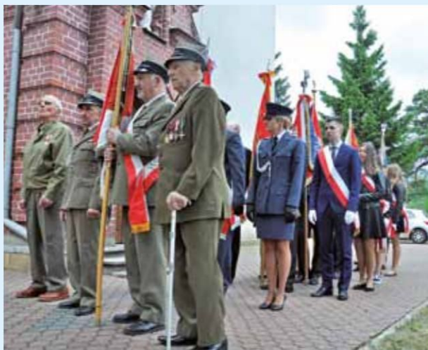
Poczty Sztandarowe przed uroczystą Mszą św.