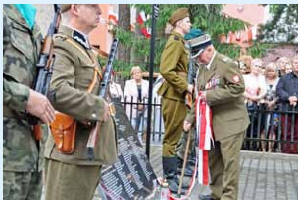
Uroczyste odsłonięcie nowej tablicy pamiątkowej