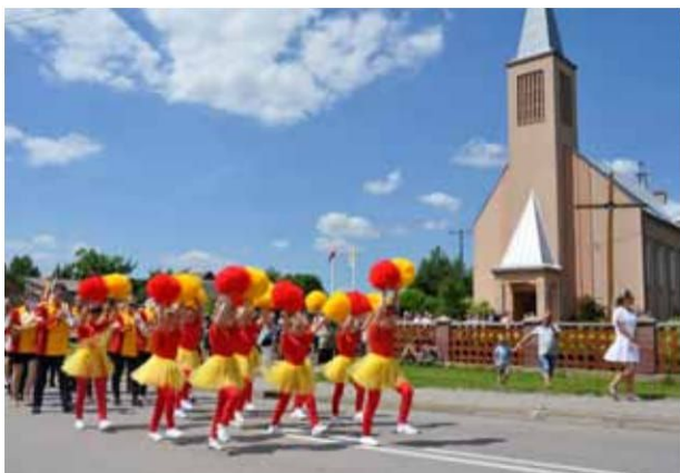
Mażoretki Gminy Łomża podczas przemarszu