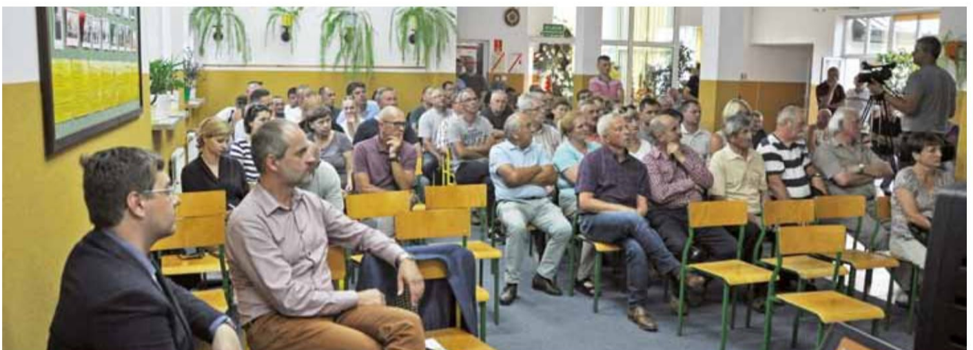
Uczestnicy spotkania dotyczącego obwodnicy