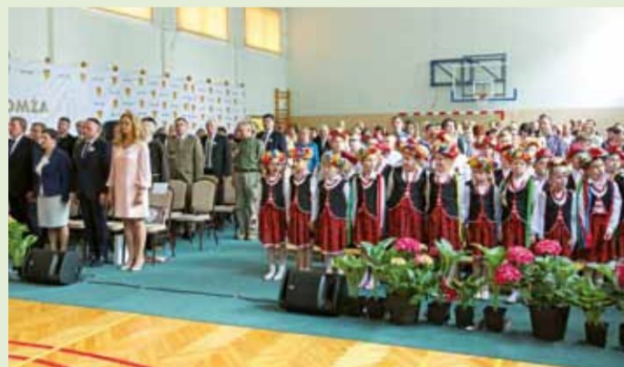
Obecni goście podczas uroczystości