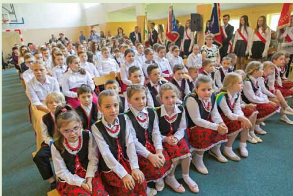
Uczniowie Szkoły Podstawowej w Konarzycach

Dzień 19.05.2018 roku zapisze się złotymi zgłoskami na kartach historii naszej szkoły, jako czas pełen refleksji i wzruszeń. Był on okazją do spotkań, wspomnień i podsumowań minionych lat. Jesteśmy ogromnie wdzięczni, że razem możemy tworzyć dalszą historię tej zasłużonej i bliskiej naszym sercom placówki. Festyn szkolny, podczas którego na dzieci czekały dmuchańce... oraz poczęstunek przygotowany przez rodziców uczniów.