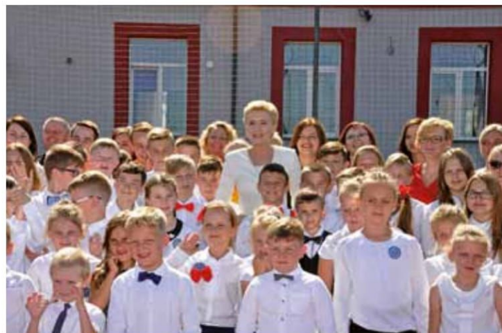
Pierwsza Dama Rzeczypospolitej Polskiej Pani Agata Kornhauser-Duda w obecności uczniów Szkoły Podstawowej w Podgórzu

W swoim przemówieniu Pierwsza Dama podziękowała nauczycielom za to, że wychowują uczniów w duchu patriotyzmu i świadomości polskich korzeni, historii i religii chrześcijańskiej. Podkreślała, jak ważna jest nauka szacunku do symboli narodowych, tradycji i kultury. Życzyła również, „aby duch kardynała Stefana Wyszyńskiego czuwał nad społecznością szkoły, a jego nauka była życiowym drogowskazem