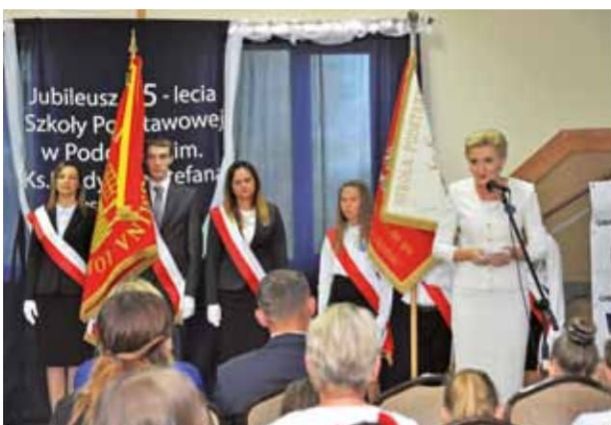
Przemówienie Pierwszej Damy