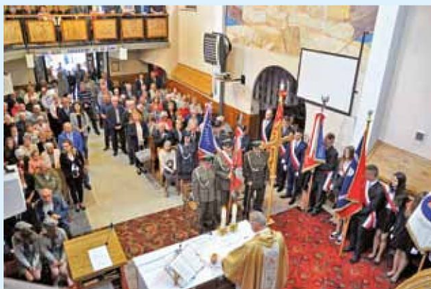
Uroczysta Msza Św. w kościele parafialnym w Wygodzie