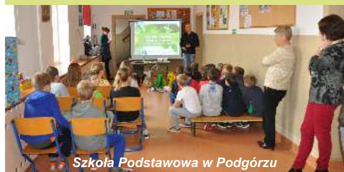
Szkoła Podstawowa w Podgórzu