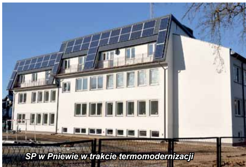
SP w Pniewie w trakcie termomodernizacji

W ciągu ostatnich dwóch lat na terenie Gminy Łomża przeprowadzono wiele remontów i inwestycji w szkołach. Poprawiły one bezpieczeństwo uczniów i nauczycieli, ale także ich funkcjonalność i estetykę. W tym roku udało się wyremontować salę gimnastyczną w Kupiskach, która przy odnowionym budynku szkoły wypadła bardzo niekorzystanie - nie tylko z zewnątrz, ale i w środku.