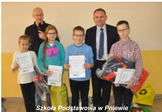
Szkoła Podstawowa w Pniewie