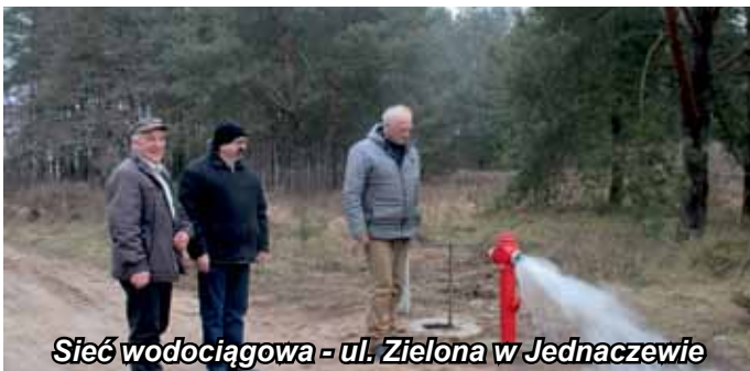
Sieć wodociągowa - ul. Zielona w Jednaczewie

Staraniem wójta i urzędników gminy, i przy poparciu Rady Gminy Łomża, w tej kadencji powstało już prawie 1,4 km nowej sieci wodociągowej w: Starych Kupiskach, Jarnutach, Starej Łomży przy Szosie, Jednaczewie i w Konarzycach, w których dodatkowo wybudowano ponad 80 mb kanalizacji. Budowa wodociągu w ul. Ładnej w Starych Kupiskach możliwa była dzięki dofinansowaniu pozyskanemu z Programu Rozwoju Obszarów Wiejskich w wysokości 85 275,00 zł. Całkowity koszt inwestycji wyniósł ok. 140 tysięcy złotych. Natomiast pozostałe inwestycje wodociągowe zrealizowane zostały dzięki uzyskanej po raz pierwszy dotacji z Międzygminnego Związku Wodociągów i Kanalizacji w Łomży, która wyniosła 80 tysięcy złotych.