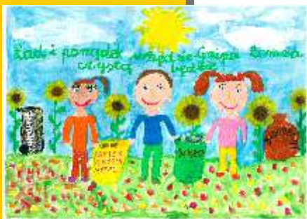
I miejsce Natalia Pięnkowska kl. III - SP w Pniewie