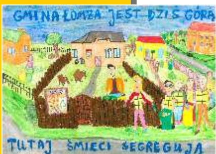
I miejsce Igor Lemański kl. VI - SP w Pniewie