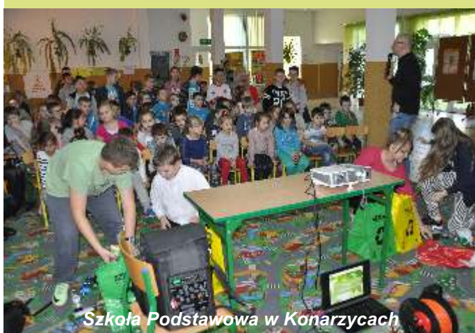
Szkoła Podstawowa w Konarzycach