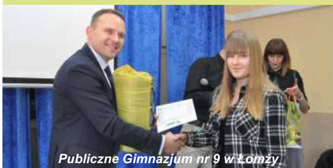
Publiczne Gimnazjum nr 9 w Łomży

Od teraz młodzi mieszkańcy gminy Łomża wiedzą jak dbać o środowisko i w jaki sposób prawidłowo segregować śmieci, by móc je ponownie wykorzystać. Wszystko to dzięki kampanii edukacyjnej pod hasłem: „EKO Gmina Łomża - dbajmy o czystość gminy”, w ramach której we wszystkich szkołach odbyły się konkursy i prelekcje ekologiczne. Dotację na realizację akcji w wysokości ponad 70%, gmina pozyskała z Wojewódzkiego Funduszu Ochrony Środowiska i Gospodarki Wodnej w Białymstoku.