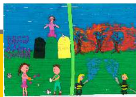
III miejsce Natalia Grzymała kl. V - SP w Czaplicach