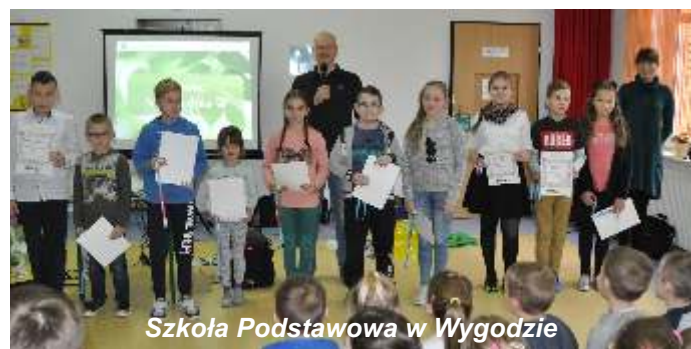
Szkoła Podstawowa w Wygodzie

Akcja bezpośrednio skierowana była do uczniów szkół podstawowych i gimnazjum na terenie gminy Łomża, a pośrednio także do ich rodziców i pozostałych domowników. Działania w projekcie zakładały dystrybucję ulotek i produkcję filmu promocyjnego. We wrześniu i październiku młodzież wzięła udział w konkursie plastycznym oraz konkursie wiedzy o gospodarce odpadami w gminie. Ci, którzy wykazali się wiedzą otrzymali w nagrodę tablety, aparaty fotograficzne lub czytniki ebook. Natomiast uzdolnieni plastycznie wygrali plecaki, śpiwory i materace turystyczne. W ramach projektu w szkołach odbyły się prelekcje ekologiczne. Uczniowie dowiedzieli się czym jest recykling, w jaki sposób prawidłowo segregować odpady w naszej gminie, a także jak zapobiegać powstawaniu dzikich wysypisk śmieci. Projekt zakończył się w listopadzie, a jego całkowity koszt wyniósł 8 665,40 zł, z czego koszty poniesione przed gminę Łomża wyniosły tylko 2 486,96 zł, dzięki pozyskanej dotacji.