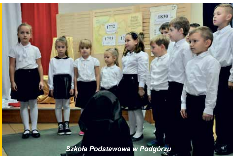
Szkoła Podstawowa w Podgórzu