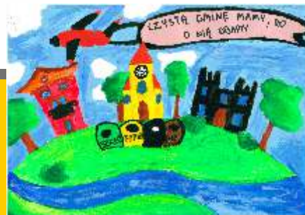
III miejsce Renata Mioduszevska kl. III a