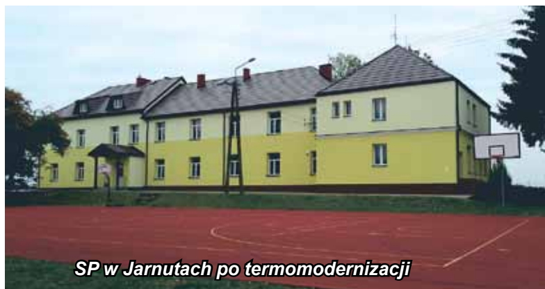
SP w Jarnutach po termomodernizacji

Przeprowadzono także remonty szkół we wspomnianej szkole w Kupiskach, a także w Jarnutach i Konarzycach. Obecnie prowadzona jest głęboka termomodernizacja Szkoły Podstawowej w Pniewie. Zgodnie z planami władz gminy remont przejdą także szkoły: w Puchałach i Czaplicach. Pieniądze na wykonanie części dokumentacji na remont dworku w Czaplicach gmina pozyskała z budżetu woj. podlaskiego. Natomiast koszt dokumentacji na szkołę w Puchałach, poniesie w całości sama.