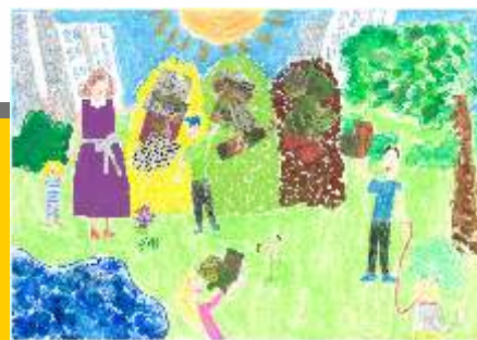
III miejsce Julia Baczyńska kl. III - SP w Podgórzu