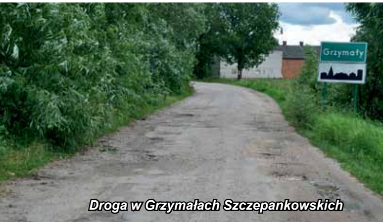
Droga w Grzymałach Szczepankowskich