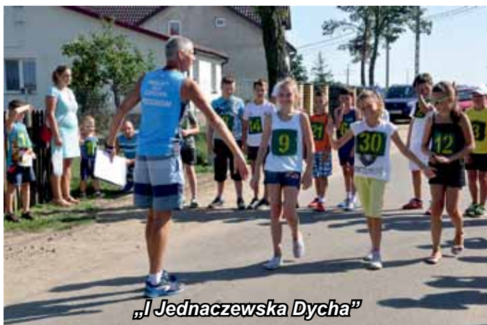
„I Jednaczewska Dycha”

Kolejnymi przykładami mogą być rozegrany w tym roku w Konarzycach turniej tenisa, oraz cykliczne już biegi, które do Jednaczewa przyciągają małych i dużych amatorów biegania z regionu i kraju. W tym roku gmina wspólnie ze stowarzyszeniem „Biegamy dla Zdrowia” zorganizowała „I Jednaczewską Dychę” pod Honorowym Patronatem Marszałka Województwa Podlaskiego.