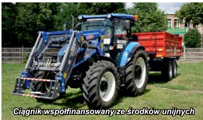
Ciągnik współfinansowany ze środków unijnych

Warto podkreślić, że w zamian za opłatę śmieciową mieszkańcy Gminy Łomża otrzymują najszerszy w regionie zakres usług. Odbiór odpadów zmieszanych odbywa się dwa razy w miesiącu, odbiór odpadów segregowanych – raz w miesiącu, a biodegradowalnych w okresie letnim dwa razy w miesiącu. Dodatkowo dwa razy do roku organizowany jest odbiór odpadów problemowych bezpośrednio z nieruchomości, którym zajmuje się Zakład Usług Komunalnych. Pracownicy wykorzystują do tego celu ciągnik z ładowaczem, którego zakup został dofinansowany w kwocie ok. 150 tysięcy złotych z Programu Rozwoju Obszarów Wiejskich.