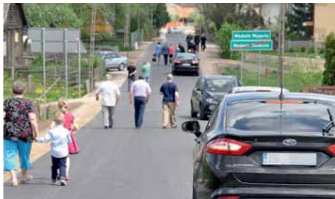
Otwarcie drogi Modzele Skudosze – Modzele Wypychy

Chcąc jak najlepiej realizować obowiązki nałożone na gminę i jednocześnie zaspakając potrzeby mieszkańców, władze gminy zdecydowały się powołać do życia Zakład Usług Komunalnych Gminy Łomża. Powstał on 1 sierpnia 2015 roku i od tego czasu na zlecenie gminy wykonuje on wiele prac, w tym także z zakresu bieżącego utrzymania dróg. Pracownicy Zakładu zajmują się m.in.: uzupełnianiem ubytków w nawierzchni dróg, naprawą dróg kruszywem czy montażem znaków drogowych. W budżecie trzeba na ten cel zabezpieczyć znaczne środki