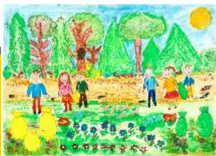
II miejsce Alicja Chomontowska kl. III - SP w Pniewie