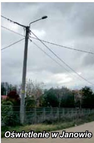
Oświetlenie w Janowie

lampy. Działania podejmowane w kierunku rozbudowy oświetlenia nie kończą się jedynie na montażu pojedynczych lamp. Wybudowane zostało całkowicie nowe oświetlenie na ul. Lawendowej i Różanej w Janowie.