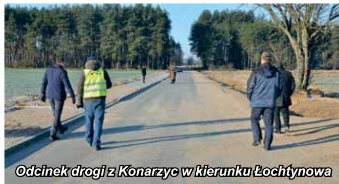
Odcinek drogi z Konarzyc w kierunku Łochtynowa

W tej kadencji samorządu duże owoce przynosi dobra współpraca ze Starostwem Powiatowym w Łomży. Wspólne działania i finansowanie z budżetu gminy Łomża, Powiatu Łomżyńskiego i Ministerstwa Infrastruktury i Budownictwa, doprowadziły do rozpoczęcia remontu drogi powiatowej nr 1948 B prowadzącej z Konarzyc w kierunku Łochtynowa. W roku 2016 wykonany został remont pierwszego odcinka tej drogi o długości 417 m, to jest ul. Młynarskiej w Konarzycach wraz z przebudową znajdującego się w jej ciągu mostu na Łomżycze. Ponadto Powiat Łomżyński udzielił gminie wsparcia finansowego w wysokości 300 tysięcy złotych przy remoncie drogi Modzele-Skudosze – Modzele-Wypychy.