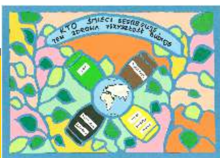
II miejsce Martyna Pietraszewska kl. VI - SP w Puchalac