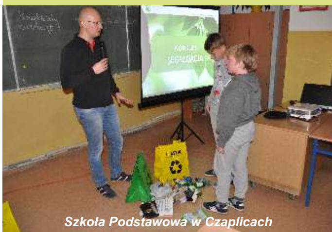
Szkoła Podstawowa w Czaplicach