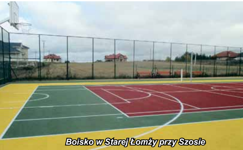
Boisko w Starej Łomży przy Szosie

Aktywny wypoczynek, sport i rekreacja – to także ważne zagadnienia, którymi zajmuje się samorząd gminy. W 2016 roku dzięki pozytywnym środkom z Ministerstwa Sportu i Turystyki, zostały wykonane dwa wielofunkcyjne boiska w Starej Łomży przy Szosie i Zawadach oraz trzy siłownie na powietrzu w Grzymałach Szczepankowskich, Boguszycach i Starej Łomży nad Rzeką. W przyszłym roku, w ramach tego samego projektu powstaną jeszcze dwa takie obiekty w Czaplach i Puchalach. Siłownia na świeżym powietrzu została zamontowana także w Konarzycach, gdzie mieszkańcy przeznaczili środki finansowe na ten cel z funduszu sołeckiego.