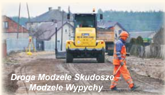
Droga Modzele Skudosze – Modzele Wypychy

ca już przystąpił do prac. Według ustaleń zapisanych w umowie, przebudowy drogi prowadzącej przez miejscowości Modzele Skudosze i Modzele Wypychy ma zakończyć się 30 kwietnia 2016r. Natomiast mieszkańcy Starych Kupisk nową nawierzchnię ul. Dwornej zyskają do 30 maja 2016 r.