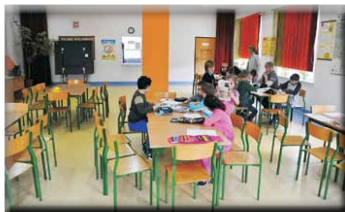
Szkoła Podstawowa w Wygodzie