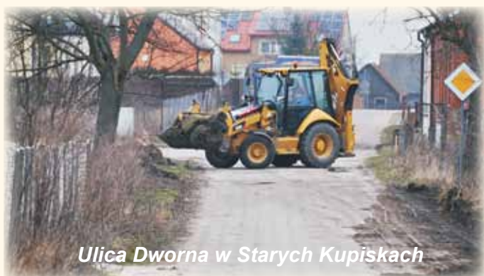
Ulica Dworna w Starych Kupiskach