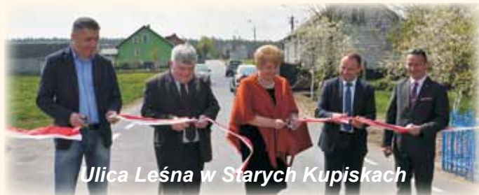
Ulica Leśna w Starych Kupiskach

utwardzoną na szerokości 5 m. Droga została oznakowana znakami pionowymi z folii odblaskowej II generacji, co znacznie poprawia ich widoczność także podczas złych warunków atmosferycznych. Ponadto zamontowane zostały na niej dwa progi zwalniające, których celem także jest poprawa bezpieczeństwa mieszkańców.