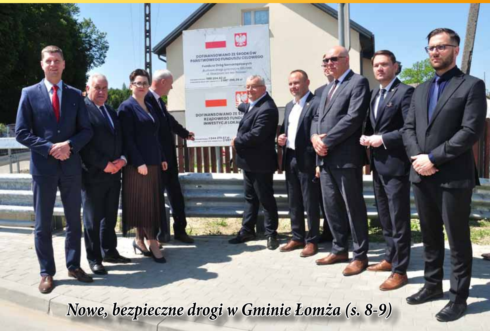
Nowe, bezpieczne drogi w Gminie Łomża (s. 8-9)