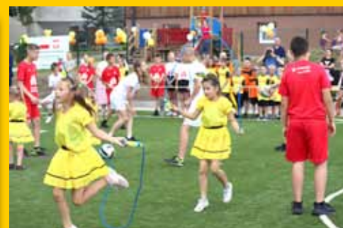
Mają boisko, o którym marzyli... (s. 10-11)