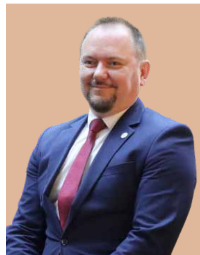
Dariusz Budrowski Prezes PARP

2 sierpnia uruchamiamy natomiast nabór do konkursu Automatyzacja i robotyzacja z programu Fundusze Europejskie dla Polski Wschodniej (FEPW). Celem działania jest przeprowadzenie procesu transformacji firmy w kierunku Przemysłu 4.0. Nabór będzie skierowany do mikro-, małych i średnich przedsiębiorstw z Polski Wschodniej. W firmach objętych pomocą przeprowadzony zostanie audyt technologiczny, zakończony opracowaniem strategii wdrożenia procesu automatyzacji/robotyzacji i rozwoju przedsiębiorstwa w oparciu o te procesy. Kolejnym etapem będą prace związane z zaprojektowaniem, modyfikacją, optymalizacją i integracją technologii cyfrowych, a także konkretne działania inwestycyjne, w tym zakup maszyn. Wnioski będzie można składać do 25 października 2023 r., a budżet naboru wynosi 100 mln zł.