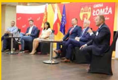
Nowe horyzonty inwestycji (s. 4-5)