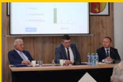
Jednomyślne wotum zaufania i absolutorium dla wójta (s. 2-3)