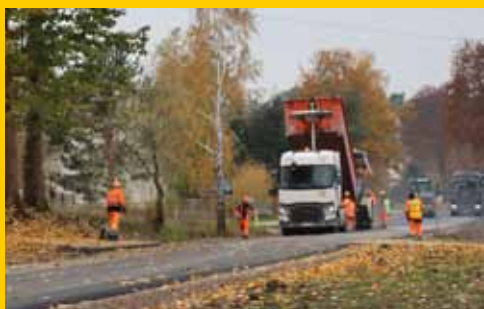
Gmina Łomża stawia na inwestycje (s. 4-5)