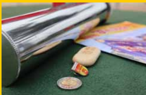
Wmurowanie aktu erekcyjnego pod rozbudowę szkoły w Konarzycach (s. 8-9)