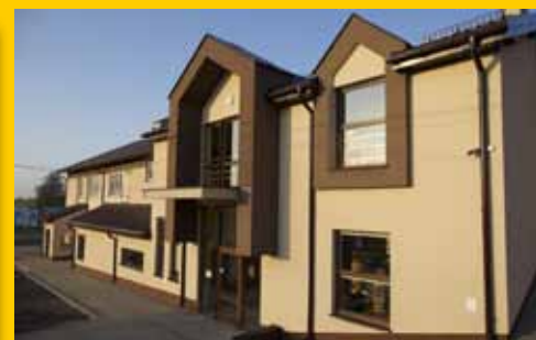
Centrum Kultury Gminy Łomża (s. 17)