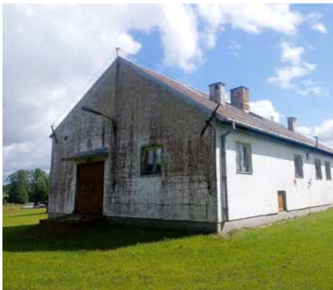
SUW w Jarnutach przed przebudową