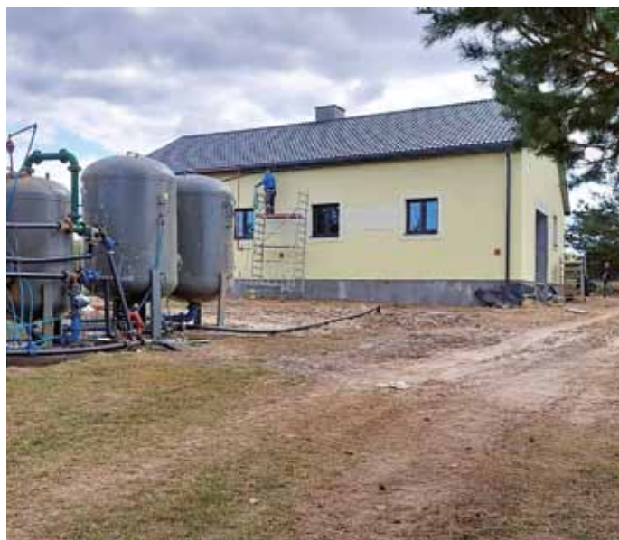
SUW w Jarnutach w trakcie przebudowy