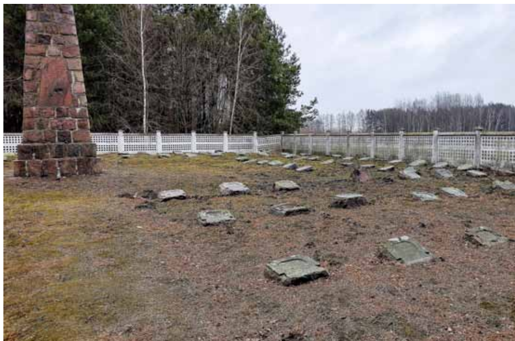
Cmentarz wojenny w Chojnach Młodych

Zadanie dofinansowano ze środków Ministra Kultury i Dziedzictwa Narodowego pochodzących z Funduszu Promocji Kultury.