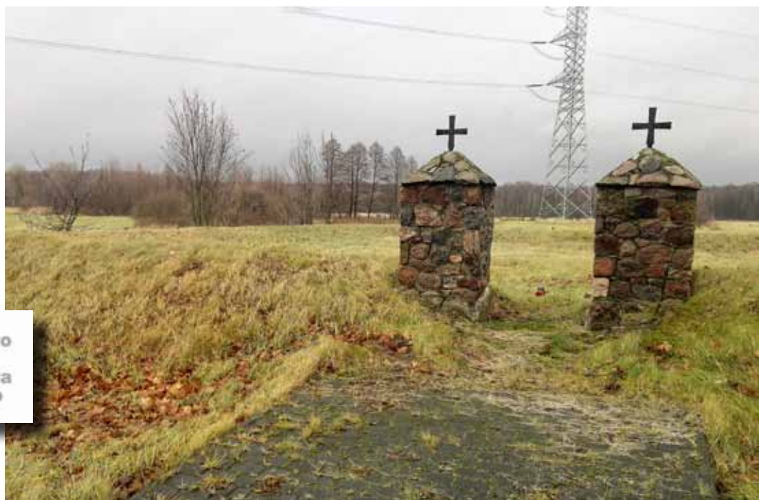
Cmentarz wojenny w Gaci