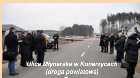
Ulica Młynarska w Konarzycach (droga powiatowa)