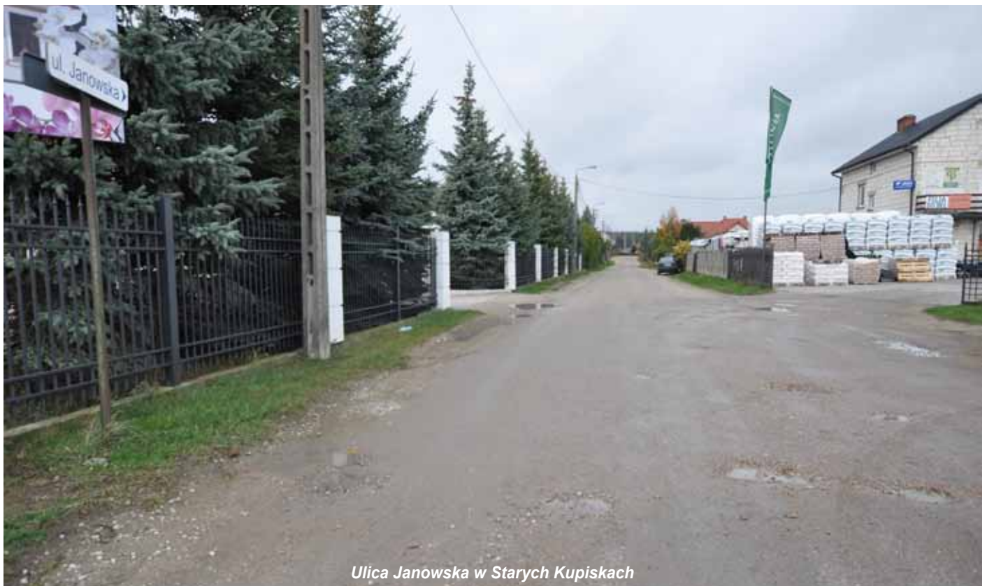
Ulica Janowska w Starych Kupiskach