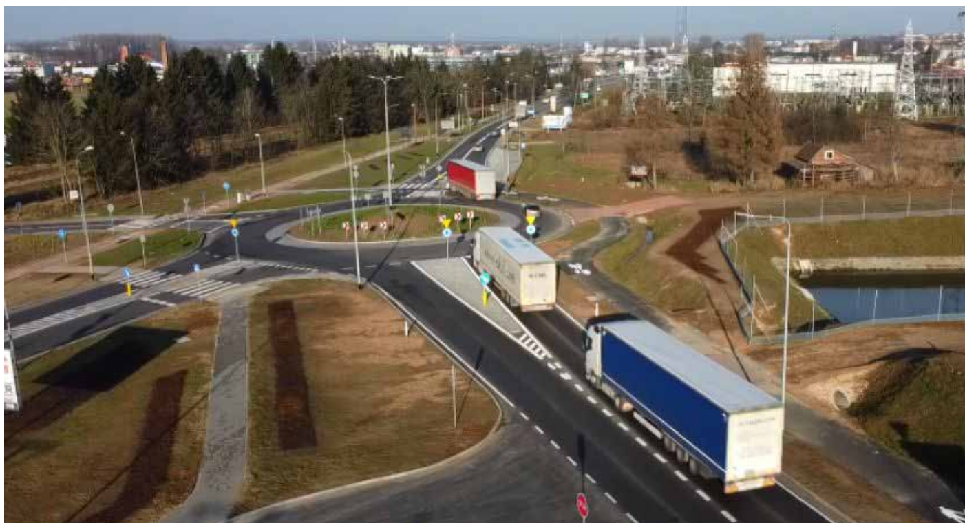
Obwodnica Konarzyc – www.mylomza.pl

Gmina Łomża rozumie potrzebę wspierania przedsiębiorczości, także firm z branży transportu drogowego i podejmując działania odpowiednie do możliwości lokalnego samorządu.