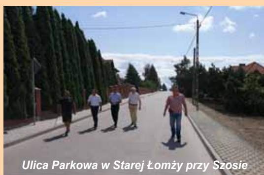
Ulica Parkowa w Starej Łomży przy Szosie