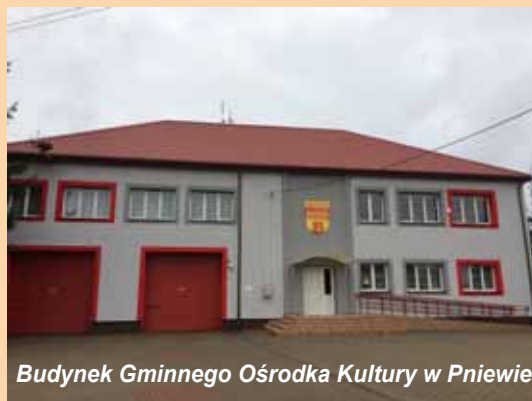
Budynek Gminnego Ośrodka Kultury w Pniewie