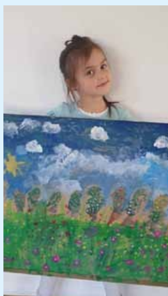
Uczniowie Szkoły Podstawowej w Konarzycach