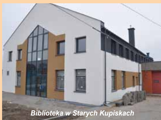
Biblioteka w Starych Kupiskach