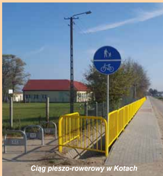
Ciąg pieszo-rowerowy w Kotach