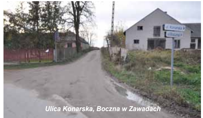
Ulica Konarska, Boczna w Zawadach

Wnioski zostały pozytywnie ocenione, co oznacza, że zgłoszone przez Gminę Łomża inwestycje będą realizowane w latach 2020-2021.