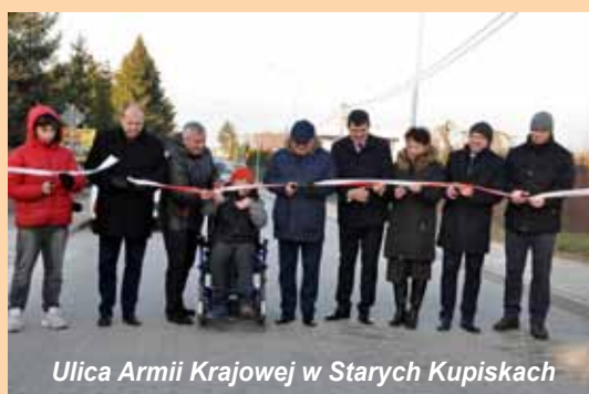
Ulica Armii Krajowej w Starych Kupiskach