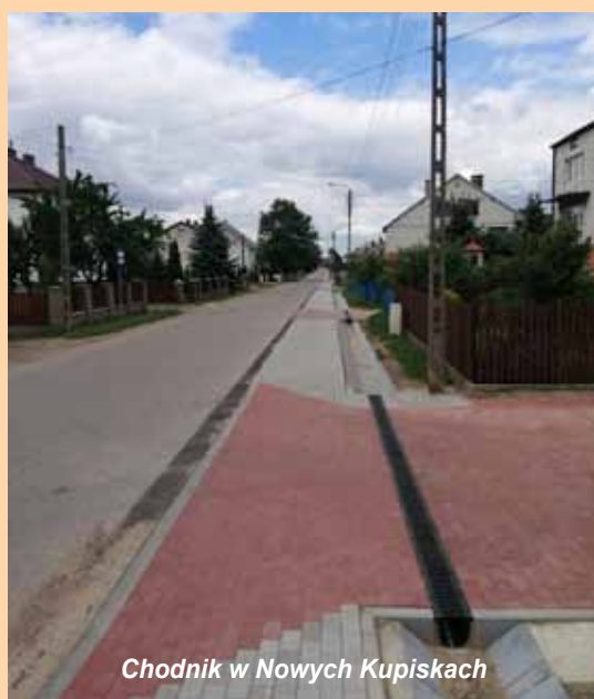
Chodnik w Nowych Kupiskach