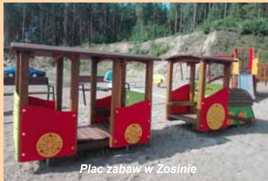
Plac zabaw w Zosinie