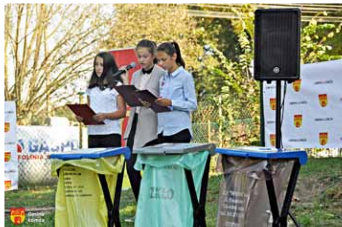
Uczennice Szkoły Podstawowej w Puchałach

- Dzięki zebranej makulaturze, dzieci z Gminy Łomża uratowały przed wycinką aż 130 drzew – mówił wójt Piotr Kłys.