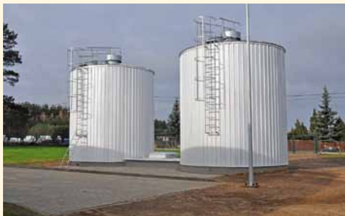
Stacja Uzdantniania Wody w Starych Modzelach