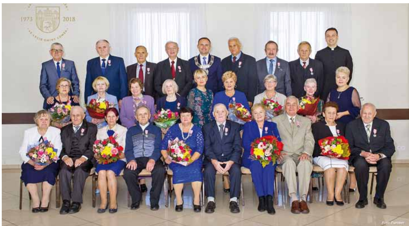
Złote Gody Jubileusz 50-lecia Pożycia Małżeńskiego Gmina Łomża - 2018r.