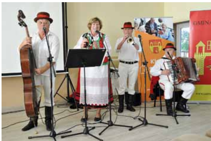
Kapela Kurpiowska Gminy Łomża podczas występu dla Seniorów