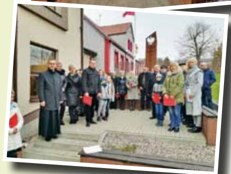
Pieśnią i słowem oddano cześć Niepodległej