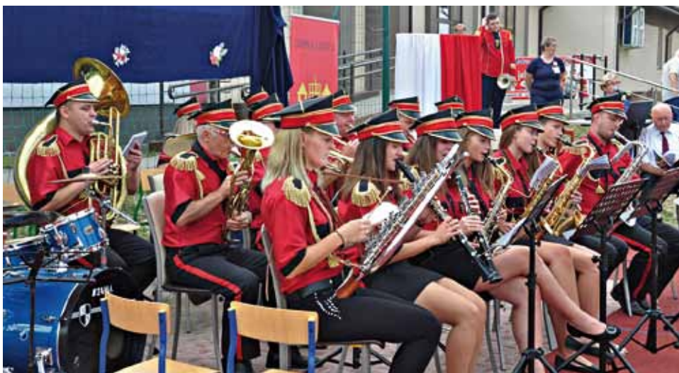
Orkiestra dęta z Kolna