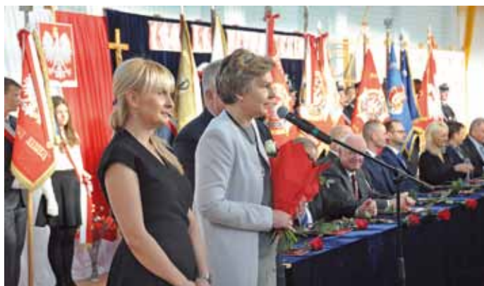
Przedstawiciele pracowników Urzędu Gminy Łomża składają gratulacje i życzenia dla Wójta