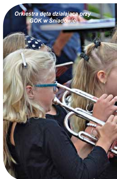
Orkiestra dęta działająca przy GOK w Śniadowie

W niedzielę 9 września w Podgórzu odbył się II festiwal Orkiestr Dętych „Dla niepodległej”. Uroczystość zgromadziła miłośników muzyki, ale również tych, którzy chcieli radośnie upamiętnić zbliżający się jubileusz 100-lecia odzyskania przez Polskę niepodległości. Festiwal został objęty patronatem honorowym przez Narodowe Centrum Kultury oraz uzyskał aprobatę Biura Programu Niepodległa. Wśród gości byli m.in. poseł