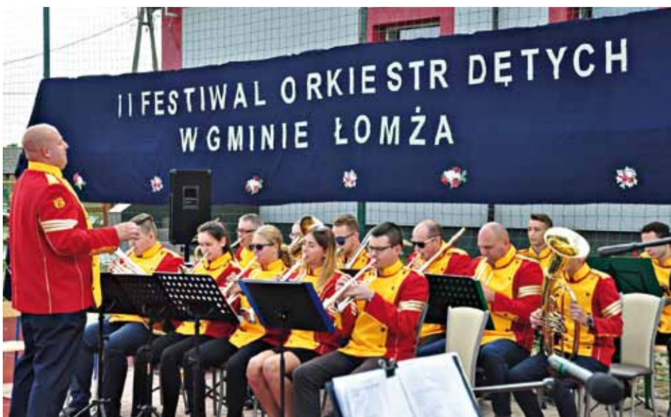
Orkiestra dęta Gminy Łomża