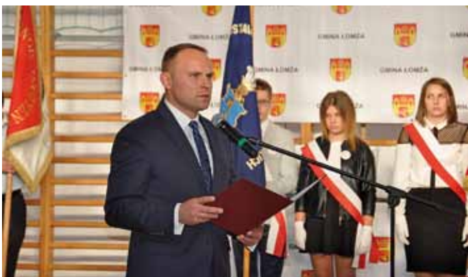
Wójt Gminy Łomża podczas ślubowania