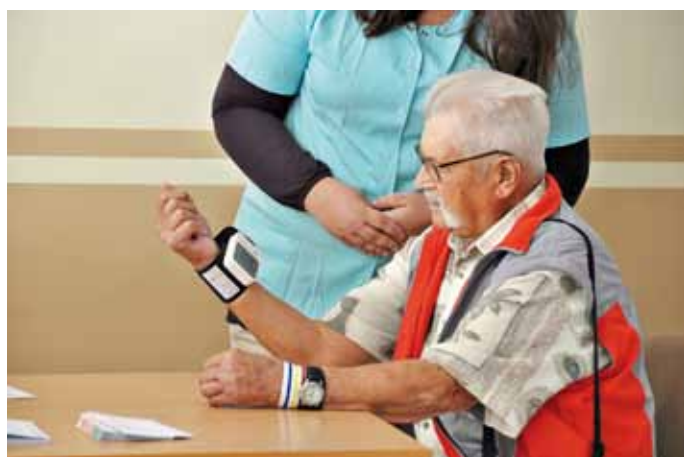
Studenci PWSiP w Łomży mierzyli ciśnienie seniorom