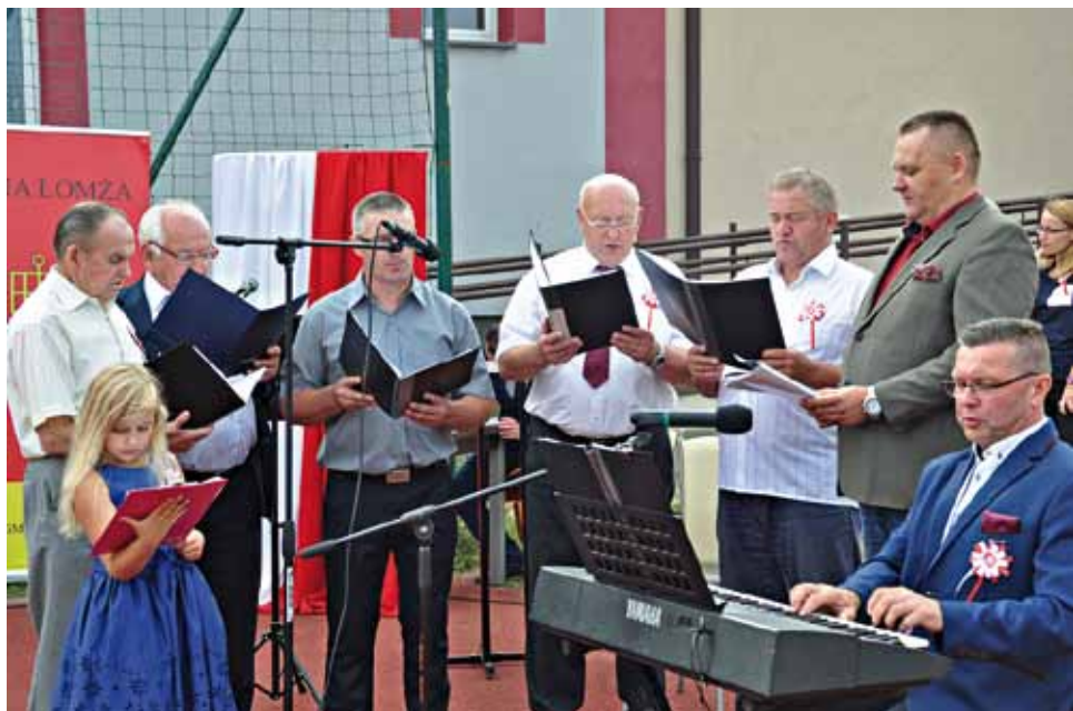
Chór Męski z Podgórza