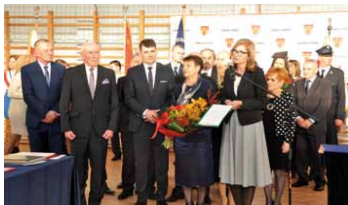
Nowa Rada gminy złożyła gratulacje Wójtowi