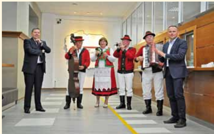
Kapela Kurpiowska Gminy Łomża w wizycie w Konsulacie RP na Białorusi

Wspierając rodziny od połowy 2015 roku wprowadziliśmy program Karta Dużej Rodziny Gminy Łomża. Jego celem jest ułatwienie rodzinom wielodzietnym dostępu do zasobów kultury, nauki i sportu, ale także obniżenie kosztów codziennego życia „rodzin 3+”. Gmina Łomża, jako pierwsza gmina wiejska na terenie województwa podlaskiego podjęła się realizacji takiego szerokiego projektu. Przyłączyło się do nas 50 lokalnych