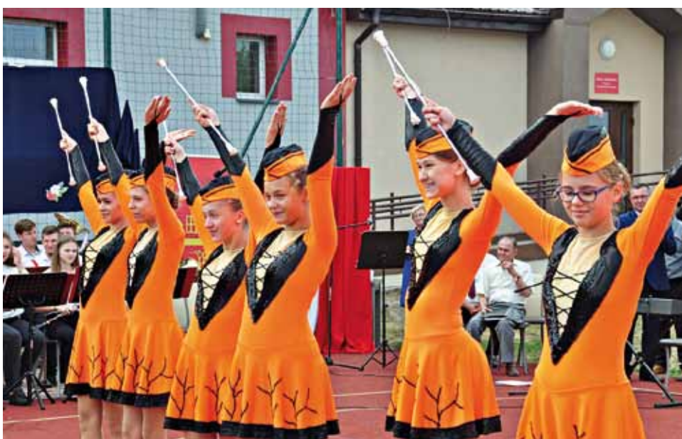
Mażoretki z Czyżewa

W niedzielę 9 września w Podgórzu odbył się II festiwal Orkiestr Dętych „Dla niepodległej”. Uroczystość zgromadziła miłośników muzyki, ale również tych, którzy chcieli radośnie upamiętnić zbliżający się jubileusz 100-lecia odzyskania przez Polskę niepodległości. Festiwal został objęty patronatem honorowym przez Narodowe Centrum Kultury oraz uzyskał aprobatę Biura Programu Niepodległa. Wśród gości byli m.in. poseł