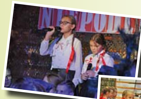
Wieczór patriotyczny w Szkole w Wygodzie