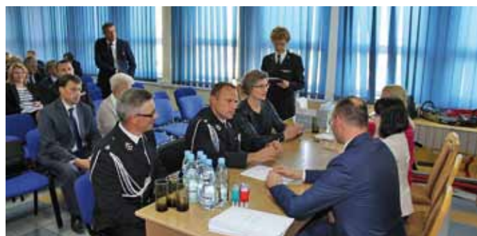
Przedstawiciele gminy i OSP podczas podpisywania umowy

Marszałek Województwa Podlaskiego na wniosek Wójta Gminy Łomża udzielił dotacji w wysokości 9 tys. złotych na zakup sprzętu ratowniczo – gaśniczego i umundurowania dla jednostek Ochotniczej Straży Pożarnej. Dzięki temu wsparciu zakupiono: agregat prądotwórczy dla OSP Konarzyce, piłę do cięcia szyb Holmatro dla OSP Podgórze i hełmy bojowe typu VULCAN – 3 szt. dla OSP Gać. Zakupiony sprzęt podniesie sprawność bojową jednostek przy różnego rodzaju zdarzeniach. Całość zadania wyniosła 13 098,30 zł