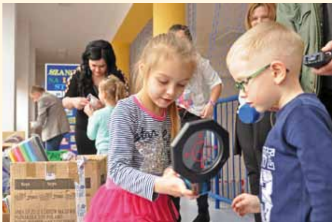
Pomoce naukowe dla przedszkolaków