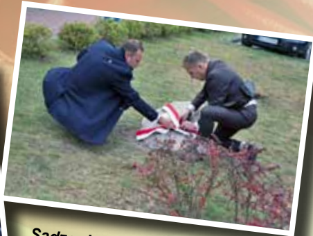
Sadzonka Dębu Niepodległości przed szkołą w Kupiskach