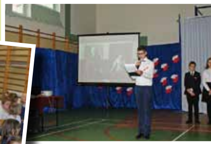
Uroczysty apel w Szkole Podstawowej im. Jana Pawła II w Kupiskach