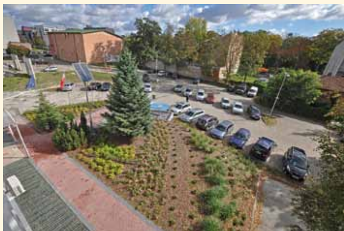
Parking przed Urzędem Gminy