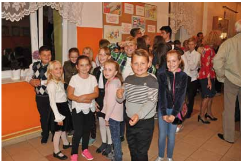
Uczniowie Szkoły Podstawowej w Jarnutach

Obiekt będzie można dodatkowo wykorzystać do organizacji imprez o charakterze rekreacyjnym, widowiskowo-estradowych oraz organizacji wystaw okolicznościowych dla całej społeczności Gminy Łomża. W budynku zaprojektowano piwnicę wraz z kotłownią, składem opału i pomieszczeniami gospodarczymi oraz parter, w którego skład wchodzi m.in.: sala gimnastyczna, dwie szatnie z umywalkami i natryskami, magazyn, wc oraz pomieszczeniami gospodarczymi. Budynek ma mieć wymiary: 38,62 m x 21,18 m, a jego wysokość to 8,10 m.