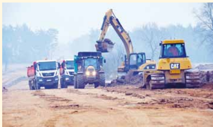
Budowa obwodnicy Starych Kupisk

W ciągu tych minionych czterech lat doświadczałem wsparcia wielu osób życzliwych naszej gminie, za co teraz chciałbym serdecznie podziękować. Bez tego wsparcia wielu ważnych dla mieszkańców inwestycji nie udałooby się zrealizować. Niedawno otrzymaliśmy 70% dofinansowania z Ministerstwa Sportu