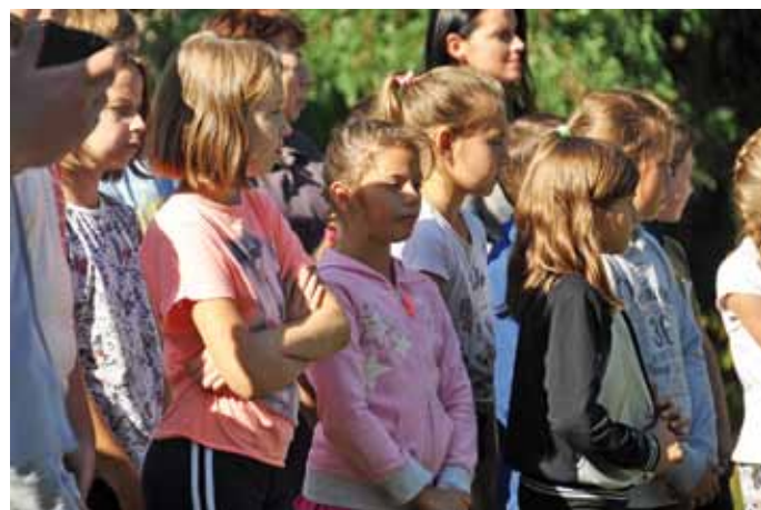
Uczniowie szkół Gminy Łomża