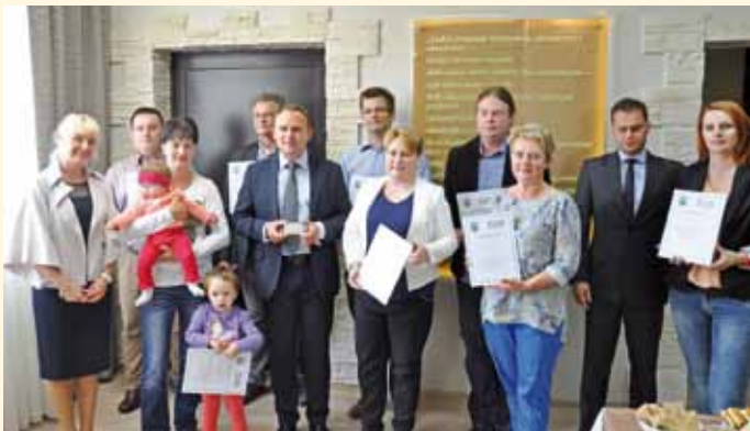
Przedsiębiorcy uczestniczący w Karcie Dużej Rodziny Gminy Łomża

przedsiębiorców oferując mieszkańcom zniżki na świadczone usługi i dodatkowe rabaty przy zakupach w sklepach. O tym, że program był potrzebny może świadczyć fakt, że do dziś wydano prawie 1000 takich kart.