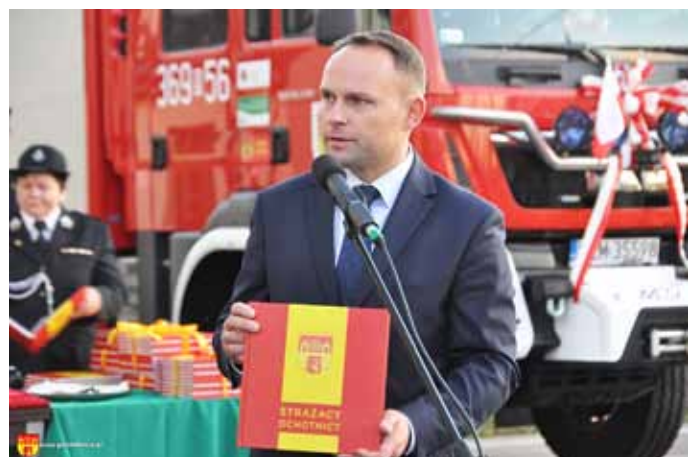
Prezentacja albumu „Ochotnicy Strażacy”