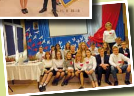
Akademia z okazji 100-lecia odzyskania niepodległości w Publicznym Gimnazjum nr 9 w Łomży