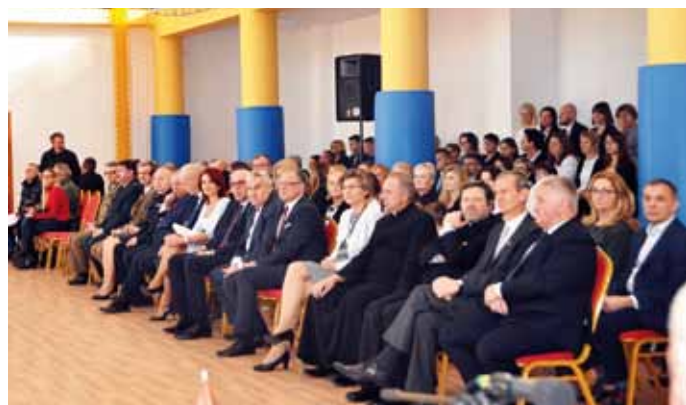
Zaproszeni goście oraz pracownicy gminy przybyli na uroczystość