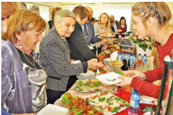
Seniorzy podczas przerwy obiadowej