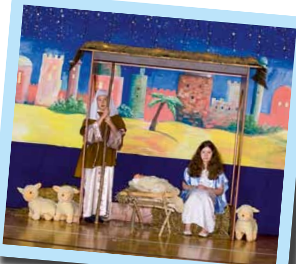
Uczniowie SP Konarzyce