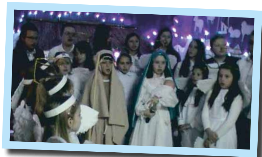
Uczniowie SP Puchały