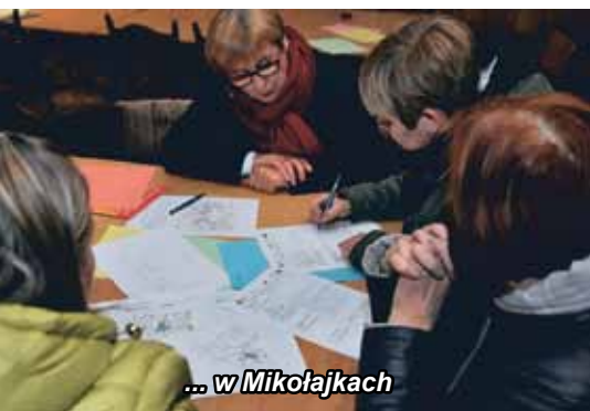
... w Mikołajkach