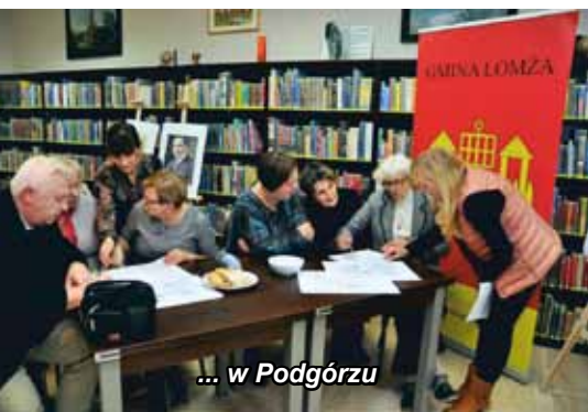
... w Podgórzu