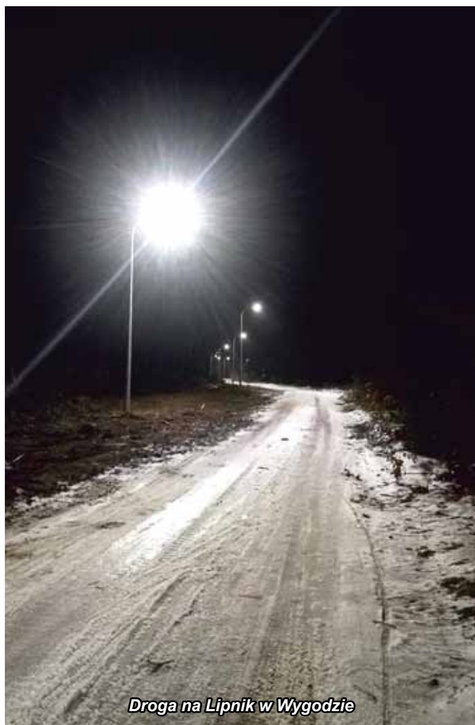
Droga na Lipnik w Wygodzie

Gmina przygotowuje się do dużego przetargu na modernizację oświetlenia na terenie całej gminy i wymianę wszystkich punktów świetlnych na energooszczędne. W ramach tego zadania lampy zostaną podłączone do tzw. centralnego komputera, z którego będzie można zarządzać natężeniem świecenia lamp oraz bezbłędnie ustalać lokalizację awarii bez konieczności sprawdzania zgłoszeń napływających z terenu.