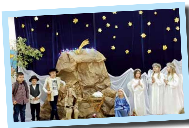
Uczniowie SP Wygoda