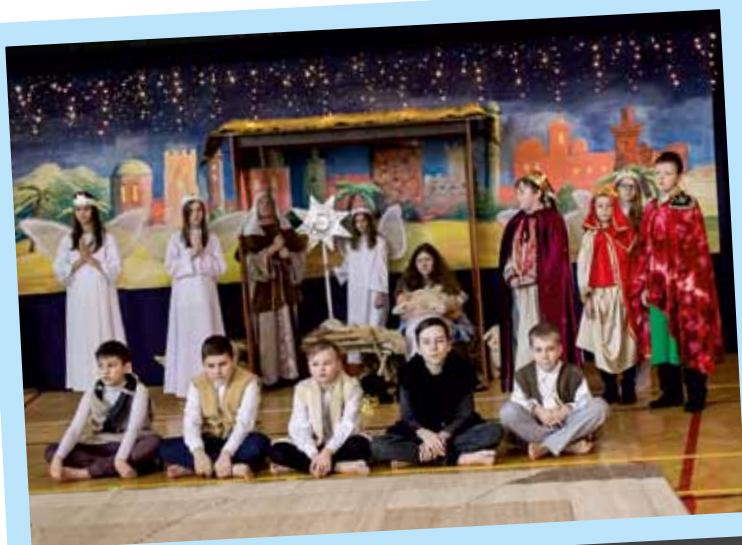
Uczniowie SP Konarzyce

Uczniowie ze Szkoły Podstawowej w Puchałach oraz Szkoły Podstawowej w Jarnutach z ogromnym zaangażowaniem przypomnieli wydarzenia sprzed ponad dwóch tysięcy lat, kiedy to w Betlejem narodził się Boże Dzieciątko. Dzieci wcieliły się w role Maryi i Józefa, pasterzy, aniołów, trzech króli, przybawających złożyć pokłon Jezusowi narodzonemu w ubogiej stajence. Nie zabrakło też Heroda. Świetności inscenizacji dodały pastorałki, kolędy, które napełniły wszystkich świąteczną radością i sprawiły, że w powietrzu czuć było magię zbliżających się świąt. Utrzymane w tradycyjnym klimacie bożonarodzeniowe