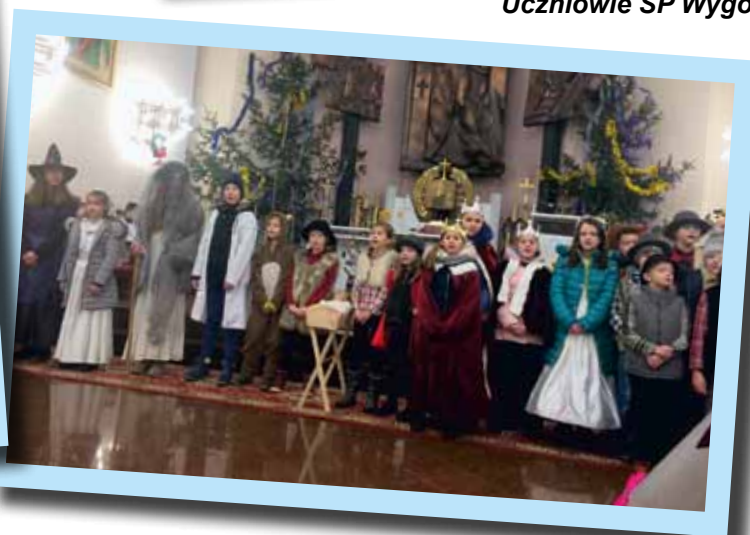
Uczniowie SP Pniewo