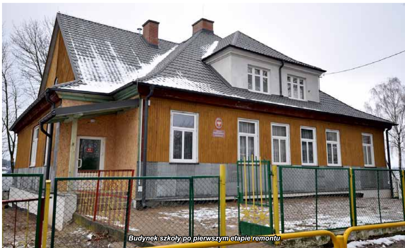
Budynek szkoły po pierwszym etapie remontu

podwaliny budynku i niektóre elementy ścian nośnych. Częściowo wykonano izolację fundamentów i ścian piwnicy, wzmocniono fundamenty oraz wykonano izolację cieplną z twardej wełny. Częściowo też zamontowano nową stolarkę okienną i zdemontowano uszkodzone szalówki na elewacji. Całkowity koszt remontu wyniósł 160 tysięcy złotych. Tymczasowo, na okres zimowy, odkryte ściany elewacji wykonawca zabezpieczył blachą trapezową, ale tym roku wykonana ma zostać całkowicie nowa elewacja budynku wraz z jego gruntownym ociepleniem wełną mineralną. Na ten cel w budżecie zabezpieczono kwotę 50 tysięcy złotych.