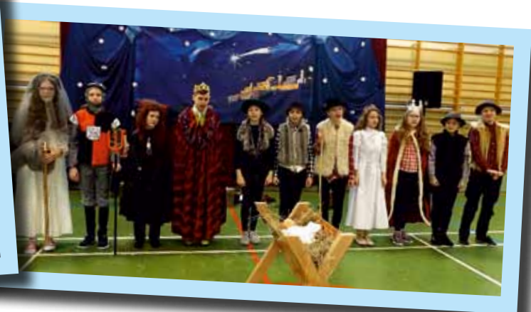
Uczniowie SP Kupiski