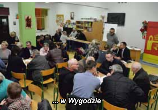
... w Wygodzie