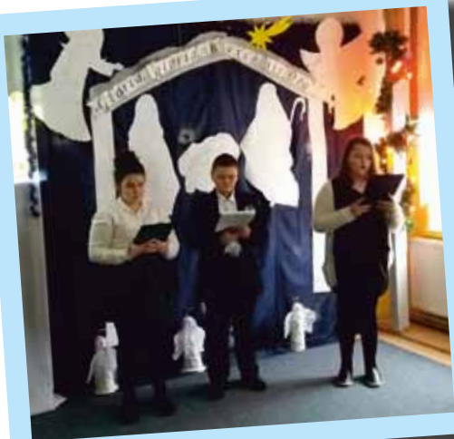
Uczniowie SP Czaplice