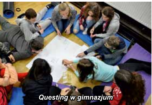
Questing w gimnazjum

Lokalny Program Rewitalizacji Gminy Łomża na lata 2018-2022 został uchwalony przez radnych gminy na grudniowej sesji. Wcześniej w powstanie dokumentu aktywnie włączyli się mieszkańcy. Ich uwagi i opinie wyrażane w trakcie czterech spotkań konsultacyjnych w Pniewie, Podgórzu, Wygodzie i Mikołajkach, zaowocowały wyodrębnieniem 35 zadań, które wspólnie uznano za konieczne do realizacji na obszarze objętym rewitalizacją.