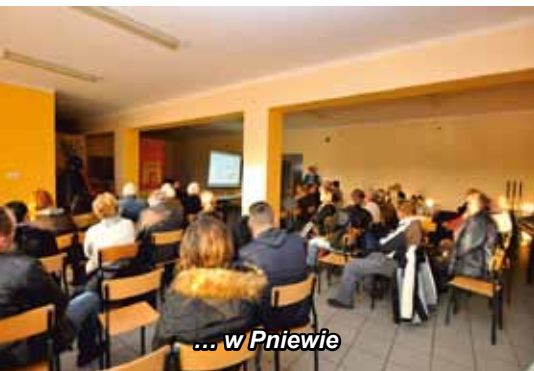
... w Pniewie