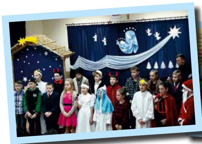
Uczniowie SP Podgórze

Uczniowie Szkoły Podstawowej znają i pielęgnują świąteczne tradycje. Jednak w tym roku zdecydowali się dodać do tradycji szczyptę czegoś nowego... Muzyczne przedstawienie przeplatało się z elementami pantomimy. Ponieważ wszyscy doskonale znają losy Maryi i Józefa, nikt nie miał trudności ze zrozumieniem tej historii opowiedzianej na nowo, bez użycia słów. Dzieci wcieliły się w postacie Świętej Rodziny, pasterzy, aniołów. Byli też trzej królowie, Adam i Ewa, a nawet wąż. Uroku inscenizacji dodały kolędy, które pozwoliły poczuć magię tych świąt.