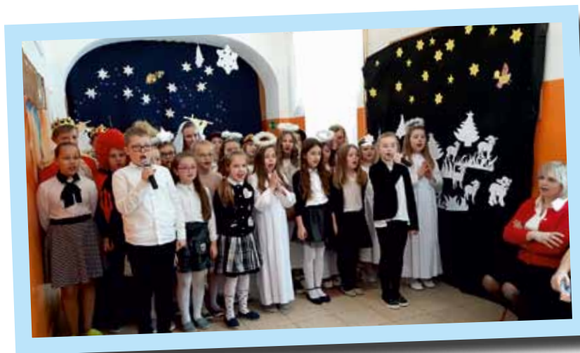
Uczniowie SP Jarnuty

Uczniowie Szkoły Podstawowej znają i pielęgnują świąteczne tradycje. Jednak w tym roku zdecydowali się dodać do tradycji szczyptę czegoś nowego... Muzyczne przedstawienie przeplatało się z elementami pantomimy. Ponieważ wszyscy doskonale znają losy Maryi i Józefa, nikt nie miał trudności ze zrozumieniem tej historii opowiedzianej na nowo, bez użycia słów. Dzieci wcieliły się w postacie Świętej Rodziny, pasterzy, aniołów. Byli też trzej królowie, Adam i Ewa, a nawet wąż. Uroku inscenizacji dodały kolędy, które pozwoliły poczuć magię tych świąt.