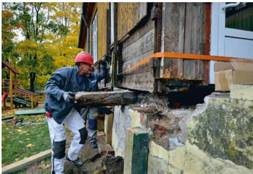
Podnoszenie budynku szkoły

Na początku grudnia nastąpił odbiór techniczny prac remontowych budynku szkoły. W ramach pierwszego etapu wykonano roboty, które przede wszystkim poprawiły bezpieczeństwo uczących się w szkole dzieci. Dokonano częściowej wymiany elementów więźby dachowej i zmianę pokrycia dachowego z eternitu na blachodachówkę. Na budynku założono nową instalację odgromową i przemurowano kominy ponad dachem. Wymieniono zniszczone