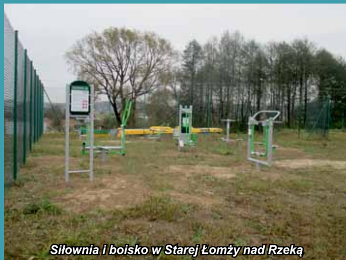
Siłownia i boisko w Starej Łomży nad Rzeką