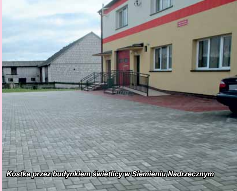
Kostka przez budynkiem świetlicy w Siemieniu Nadrzecznym