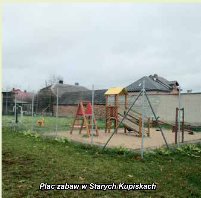
Plac zabaw w Starych Kupiskach