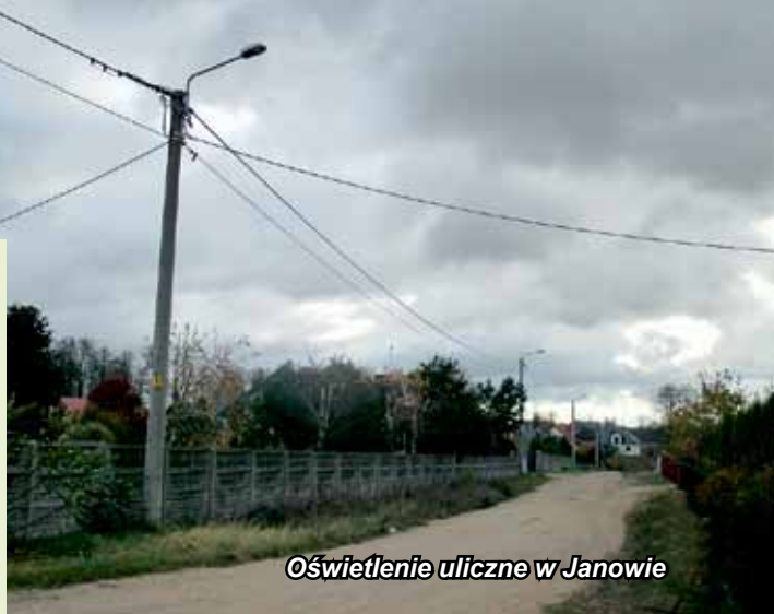
Oświetlenie uliczne w Janowie