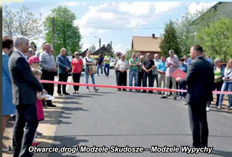
Otwarcie drogi Modzele Skudosze – Modzele Wypychy