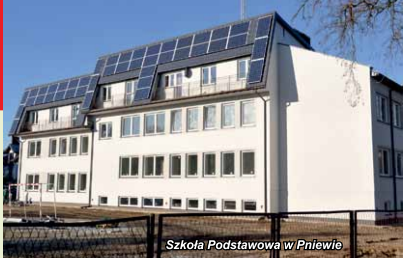
Szkoła Podstawowa w Pniewie