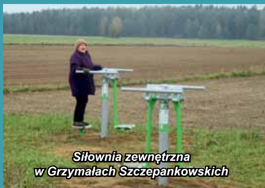
Siłownia zewnętrzna w Grzymałach Szczepankowskich