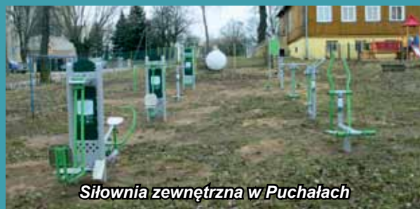
Siłownia zewnętrzna w Puchałach