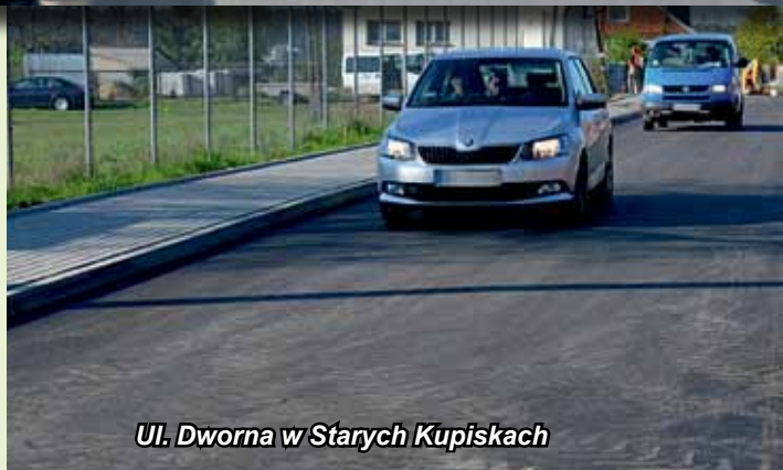
Ul. Dworna w Starych Kupiskach