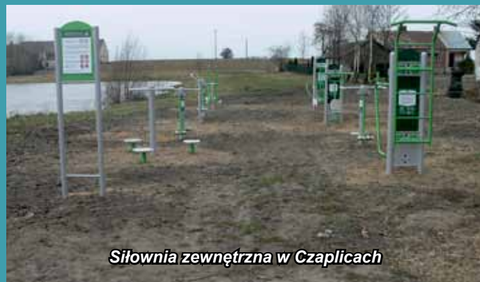
Siłownia zewnętrzna w Czaplicach