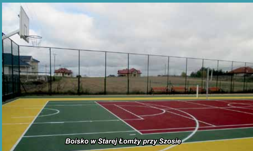
Boisko w Starej Łomży przy Szosie