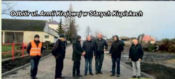
Odbiór ul. Armii Krajowej w Starych Kupiskach