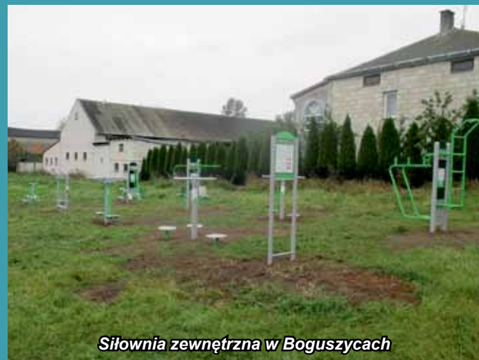
Siłownia zewnętrzna w Boguszycach