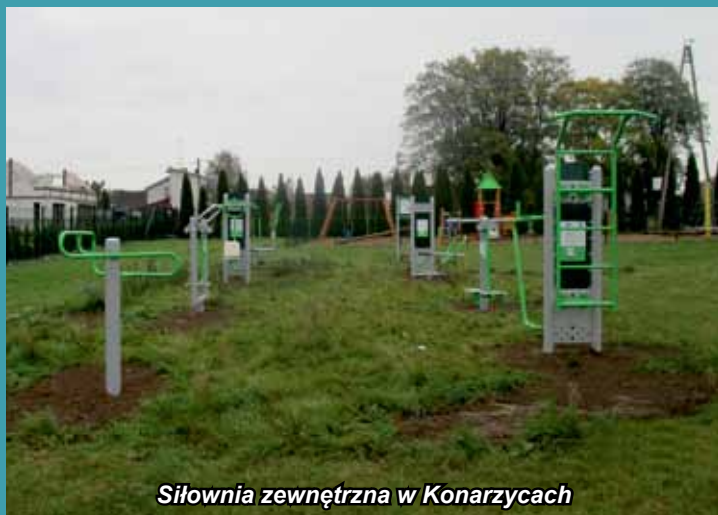
Siłownia zewnętrzna w Konarzycach