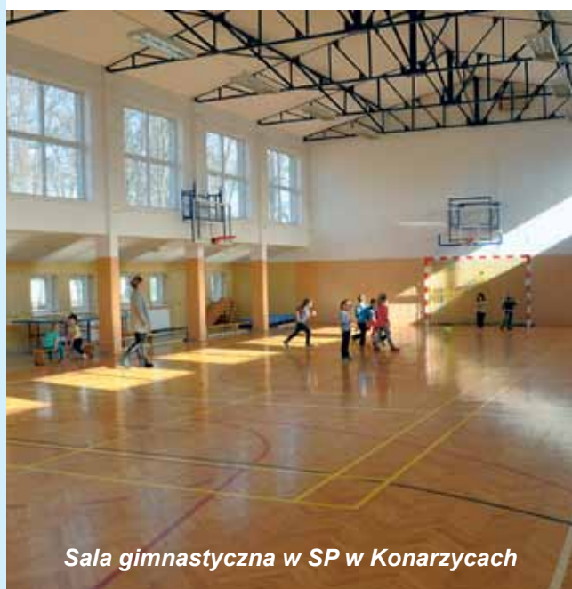
Sala gimnastyczna w SP w Konarzycach