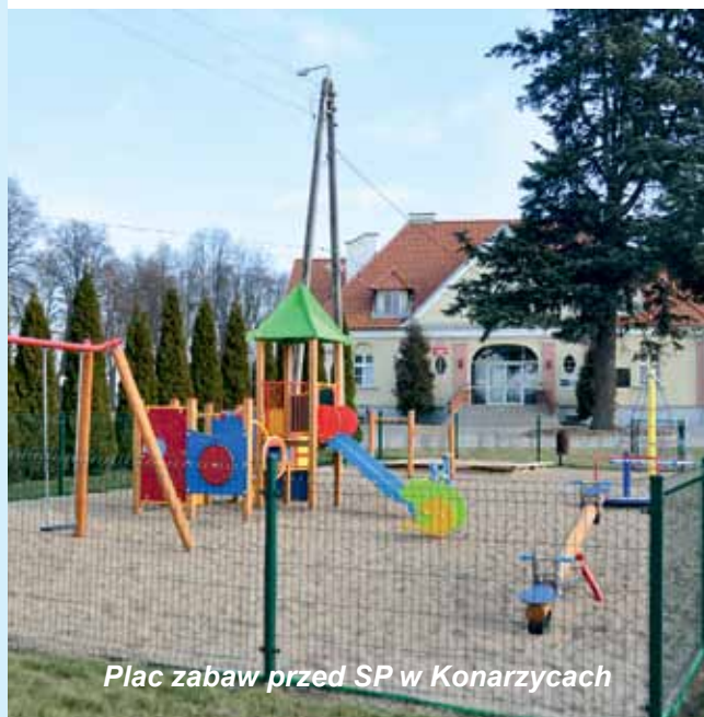
Plac zabaw przed SP w Konarzycach