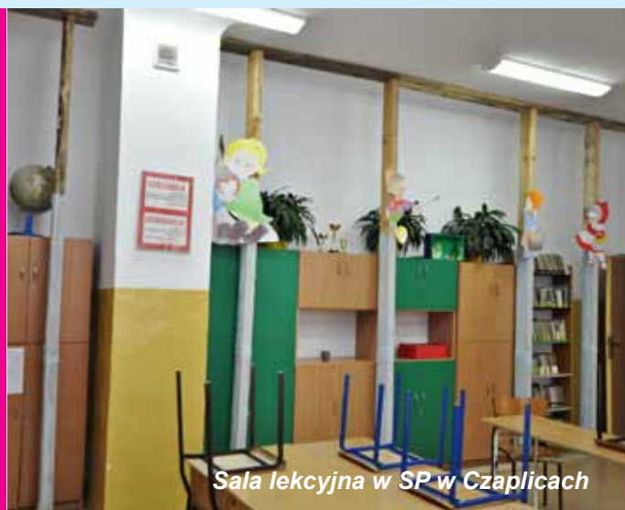
Sala lekcyjna w SP w Czaplích

Zabytkowy budynek, w którym mieści się szkoła w Czaplích pochodzi z XIX wieku. Jego stan jest zły, a generalny re-