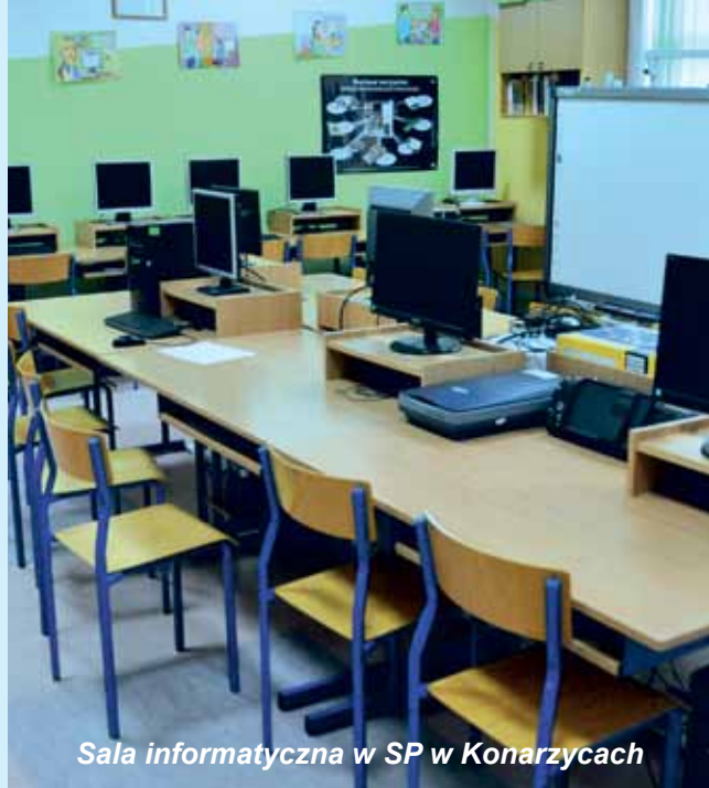
Sala informatyczna w SP w Konarzycach

Po odrestaurowaniu, zgodnie z zaleceniami konserwatora zabytków, budynku po zlikwidowanej Szkole Podstawowej w Czaplicach, nadal będzie on wykorzystywany dla dobra lokalnej społeczności. Po przeprowadzonym remoncie, jeżeli taka będzie wola mieszkańców, wójt gminy Łomża przewiduje możliwość utworzenia tu punktu przedszkolnego.