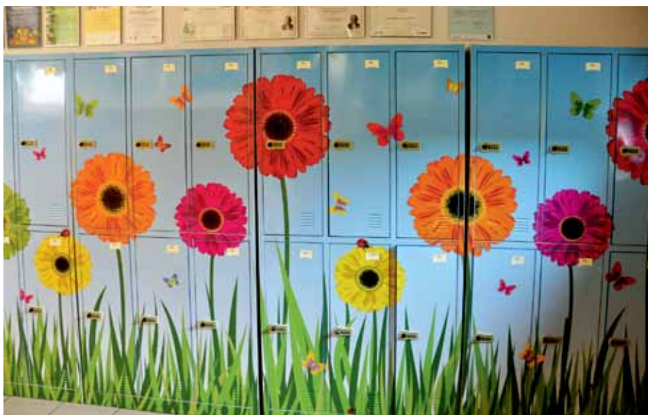
Nowoczesne szafki ubraniowe w SP w Konarzycach

Przed budynkiem gminnego gimnazjum znajdującego się w Łomży została wyłożona kostka polbruk na schodach prowadzących do szatni, ze względu na bezpieczeństwo uczniów. Przeprowadzono także remont łazienki, w której położono terakotę, wyszpachlowano i pomalowano ściany.