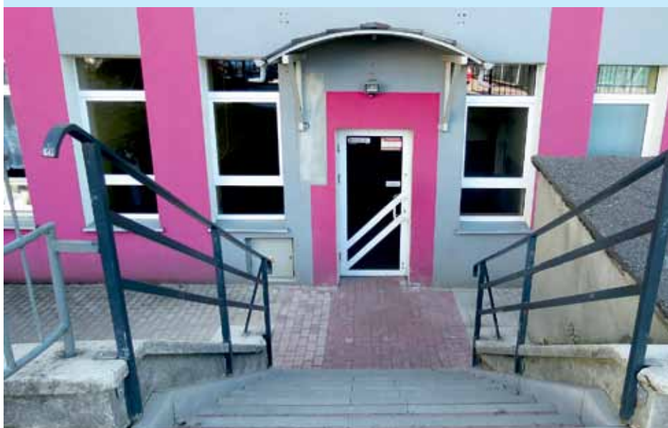
Nowe schody do szatni w PG nr 9 w Łomży