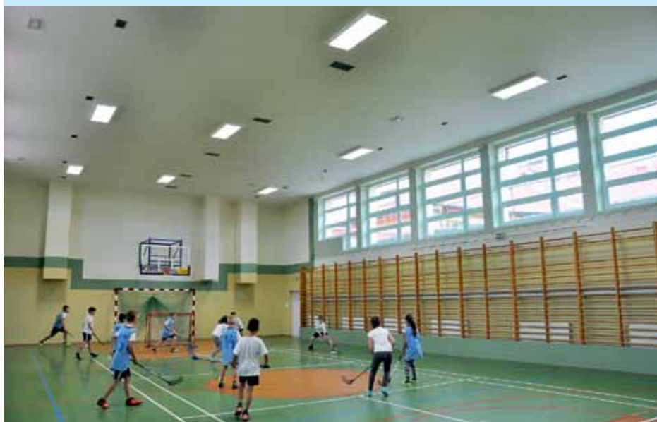
Sala gimnastyczna przy SP w Kupiskach