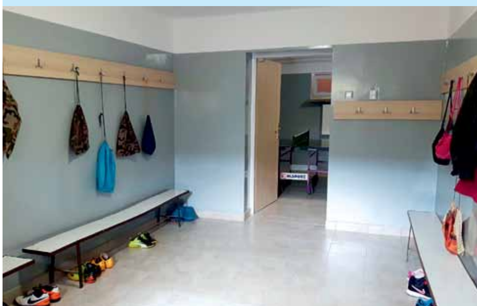
Wyremontowana szatnia w SP w Jarnutach