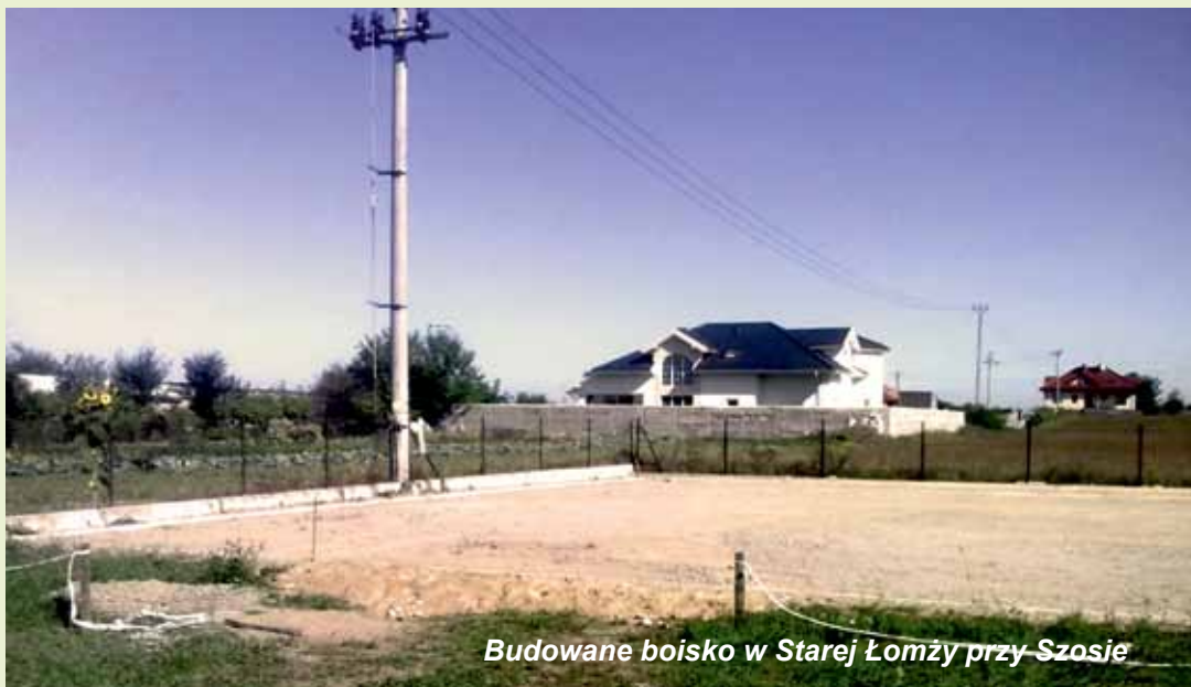
Budowane boisko w Starej Łomży przy Szosie

MAX, wyznaczyła termin zakończenia prac na końcówkę października. W tym roku powstaną trzy z pięciu siłowni, w miejscowościach: Grzymały Szczepankowskie, Boguszycy i Stara Łomża nad Rzeką. Z uwagi na dwuetapowość projektu, obiekty sportowe w Czaplicach i Puchałach zostaną wykonane w przyszłym roku. Siłownie wyposażone będą w kilka urządzeń do ćwiczeń na świeżym powietrzu tj.: wahałło, biegacz, orbitrek, wioślarz, prasa nożna czy twister. Dodatkowo – poza zakresem projektu – powstanie siłownia w Konarzycach, której koszt zostanie sfinansowany z funduszu sołeckiego. O przeznaczeniu środków na ten cel zdecydowali mieszkańcy w ubiegłym roku.