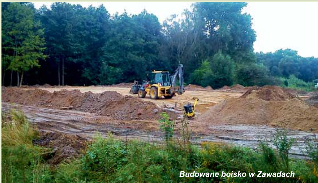
Budowane boisko w Zawadach