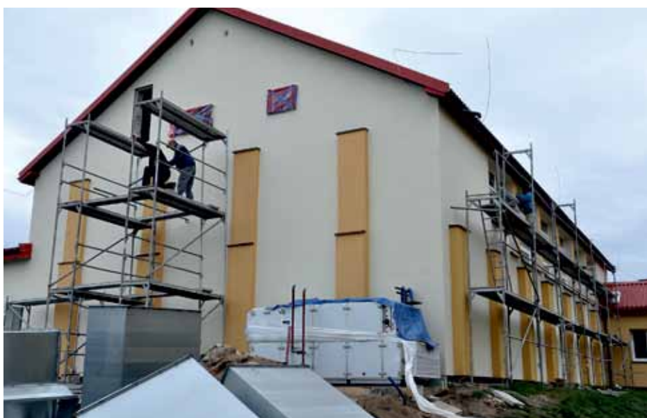
Budynek sali gimnastycznej przy SP w Kupiskach

Tradycyjnie w wakacje, gdy dzieci opuściły szkoły, rozpoczęły się w nich remonty. W tym roku prace - malowanie ścian, adaptacja pomieszczeń, wymiana wykładziny i wiele innych prac – prowadzone były w prawie wszystkich szkołach i oddziałach przedszkolnych gminy Łomża. Większość udało się zakończyć zanim uczniowie powrócili do szkół. W Kupiskach trwają jeszcze prace związane z dociepleniem sali gimnastycznej, a szkoła w Pniewie przygotowywana jest do kompleksowej termomodernizacji. Łączne nakłady na tegoroczne remonty i modernizacje w placówkach oświatowych gminy Łomża to blisko 1 mln 500 tys. zł. Znaczną część środków samorząd pozyskał z Mechanizmu Finansowego Europejskiego Obszaru Gospodarczego.