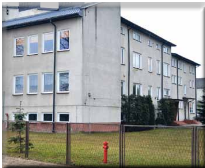
Budynek Szkoły Podstawowej w Pniewie

Znaczne środki finansowe zaangażowane zostały także w infrastrukturę szkolną w celu podniesienia komfortu i bezpieczeństwa dzieci oraz nauczycieli w szkołach wiejskich. Dokończono Przeprowadzono termomodernizację budynków Szkół Podstawowych w Jarnutach, Konarzycach i Kupiskach. W ubiegłym roku rozpoczęto także starania o przeprowadzenie kompleksowej termomodernizacji budynku szkoły w Pniewie. Opracowano dokumentację techniczną niezbędną do aplikowania o środki zewnętrzne. Bez dofinansowania gmina nie będzie miała możliwości wykonania inwestycji, ze względu na szeroki zakres prac i wysokie koszty przedsięwzięcia. Planowane jest m. in. docieplenie przegród budynku, wymiana kotła czy instalacja paneli fotowoltaicznych. Władze gminy Łomża już podejmują działania zmierzające do uzyskania wsparcia na ten cel.