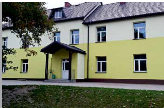
Budynek SP w Jarnutach przed i po modernizacji