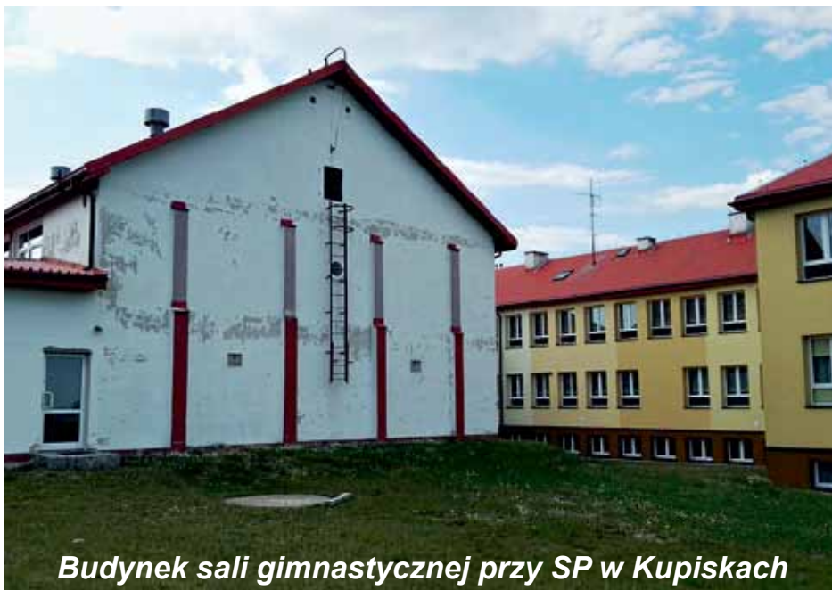
Budynek sali gimnastycznej przy SP w Kupiskach

Przed remontem budynki szkół generowały duże koszty eksploatacyjne. Dlatego też gmina podjęła starania, które doprowadzą do zmniejszenia strat i zużycia ciepła oraz podwyższenia sprawności instalacji centralnego ogrzewania i źródła ciepła.