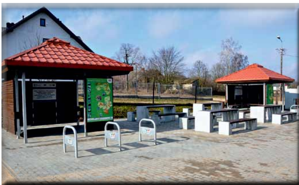
Miejsce Obsługi Rowerzystów w Pniewie

budowie wodociągu w Starych Kupiskach. Na poczet efektywnego gospodarowania odpadami komunalnymi zakupiono ciągnik z przyczepą do wywozu śmieci, którego koszt kwalifikowalny został zrefundowany w ok. 75 % z Programu Rozwoju Obszarów Wiejskich, podobnie jak wodociąg.