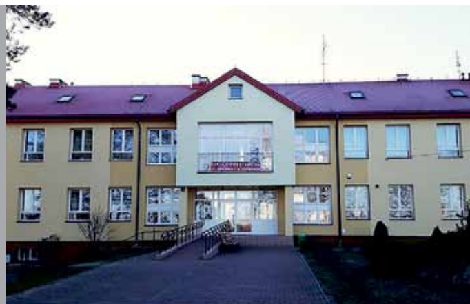
Budynek SP w Kupiskach przed i po modernizacji