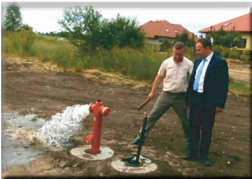
Wodociąg przy ul. Ładnej w Starych Kupiskach

Ze środków finansowych zabezpieczonych w ubiegłorocznym budżecie poprawiono także infrastrukturę wodociągową, dzięki