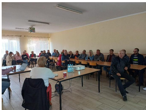
Zdjęcia 3-4. Otwarte spotkanie konsultacyjne w Pniewie w dniu 5 maja 2025 r.