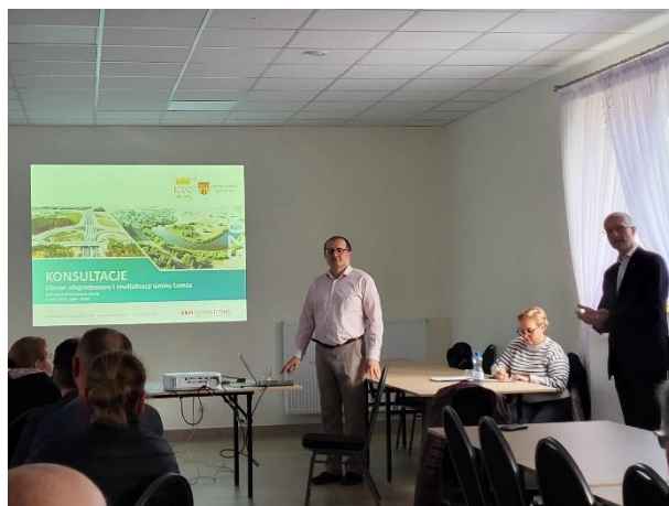
Zdjęcia 5-6. Otwarte spotkanie konsultacyjne w Mikołajkach w dniu 6 maja 2025 r.