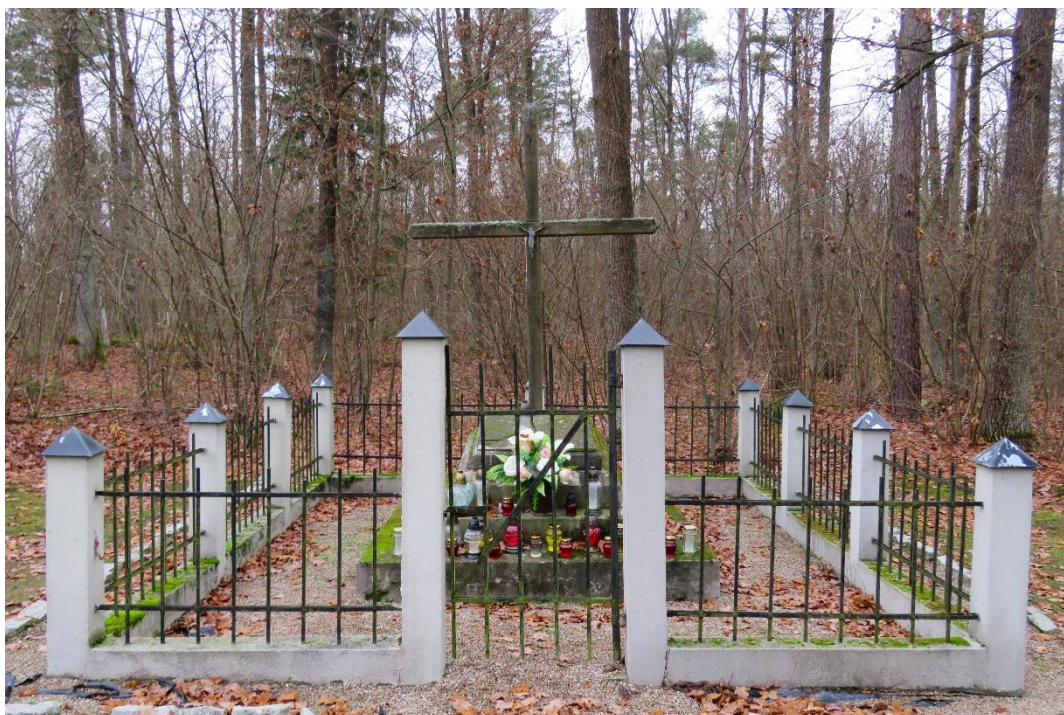
Symboliczna mogiła w miejscu cmentarza z czasów II wojny światowej w Pniewie