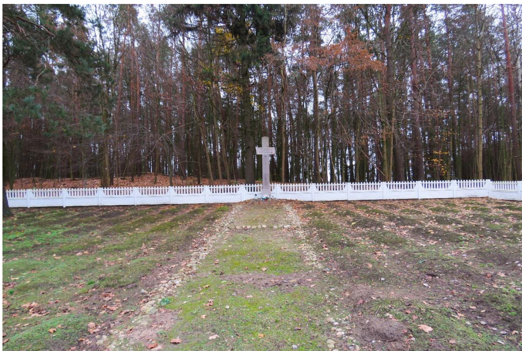
Cmentarz wojenny z czasów I wojny światowej w Sierzputach Młodych

W lesie pod wsią Pniewo znajduje się miejsce, gdzie pochowanych zostało około 400 osób, cywilów, Polaków i Żydów oraz żołnierzy Armii Krajowej, zamordowanych przez nazistów w latach 1942-1943. W tym miejscu wystawiono symboliczną mogiłę, złożoną z lastrykowych płyt, z których najwyższa zawiera inskrypcję z nazwiskami ofiar, nad nią drewniany krzyż. Mogiła ujęta jest w betonowe ogrodzenie z metalowymi przesłami. Przestrzeń wokół wysypana została drobnymi kamieniami.