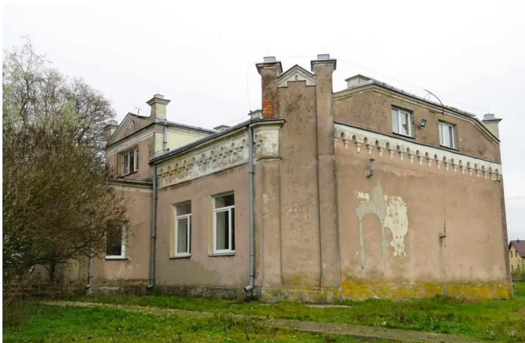
Budynek dworu w Czaplicach

Dwór w Czaplicach to budowla rozmieszczona na planie prostokąta o ściętych narożnikach, posadowiona na kamiennym fundamencie, murowana z cegły, otynkowana, jednokondygnacyjna z użytkowym poddaszem, przykryty spłaszczonym dachem naczółkowym. Fasada symetryczna, pięcioosiowa, z otworem drzwiowym w środkowej osi, ujętym w murowany ganek nad którym jednoosiowa facjata zwieńczona trójkątnym szczytem. Ścięte narożniki ścian oraz narożniki facjaty zwieńczone sterczynami, ściany zwieńczone szerokim fryzem arkadowym.