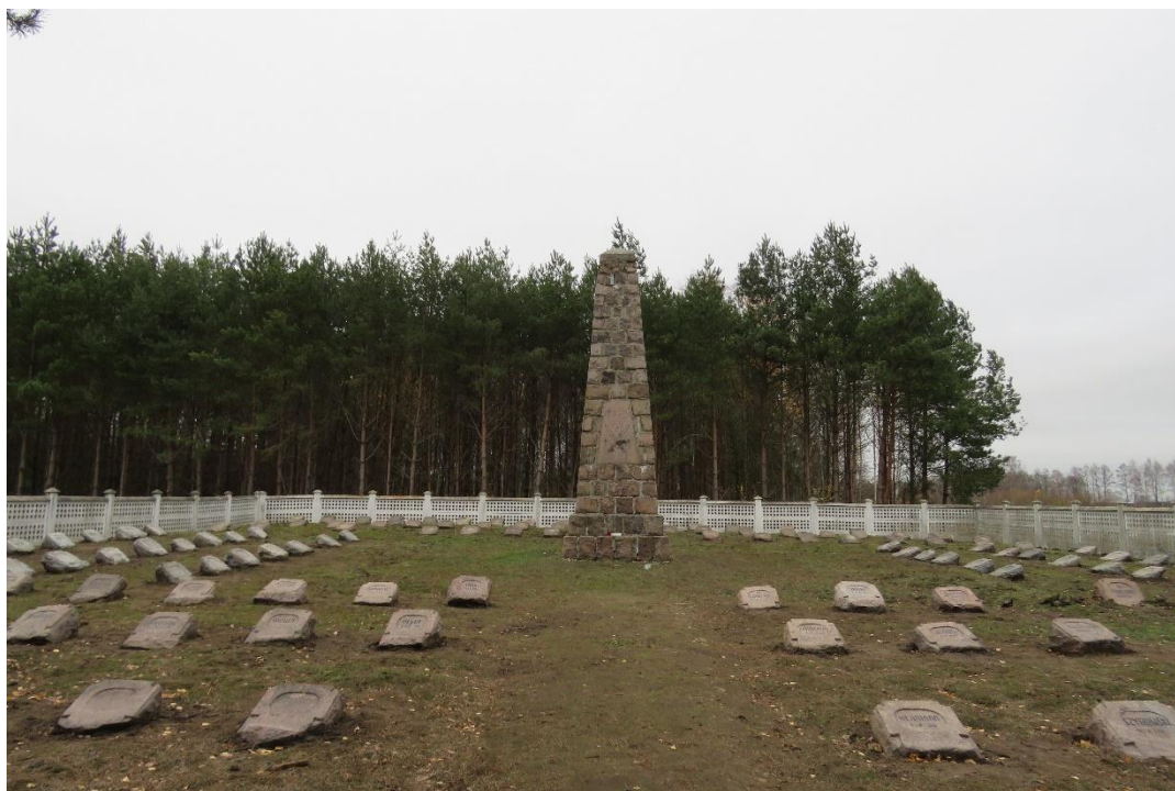
Cmentarz wojenny z czasów I wojny światowej w Chojnach Młodych