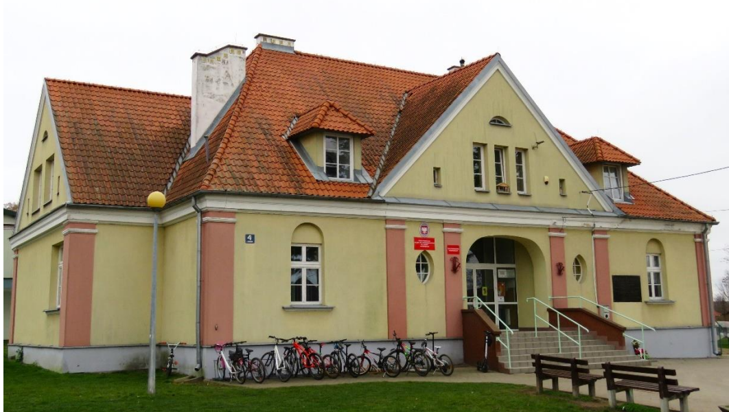
Budynek szkolny w Konarzycach

Wieś Puchały ma dwa cmentarze, oba są objęte ochroną prawną przez wpis do rejestru zabytków województwa podlaskiego. Tak zwany stary cmentarz został założony jako przykościelny, wokół nieistniejącego już kościoła. Położony jest na wzgórzu, rozmieszczony na planie kwadratu, obecnie częściowo wygrodzony ogrodzeniem nowej plebanii. Układ alejek zatarty. Zachowanych kilka nagrobków o walorach artystycznych oraz zniszczone żeliwne ogrodzenia kwater rodzinnych. Najstarszy zachowany nagrobek pochodzi z 1876 r.