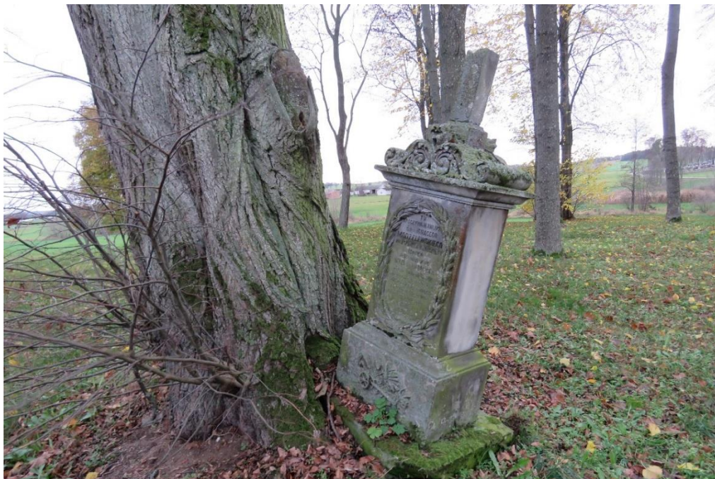
Nagrobek na tzw. starym cmentarzu w Puchałach

rozmieszczony na planie prostokąta, na kamiennych fundamentach, murowany z cegły, nieotynkowany, z neogotyckim detalem architektonicznym. ściany wzdłużne trójosiowe, okienne, wejście od południa. Dach dwuspadowy kryty dachówką, z wieżyczką i sygnaturką nad wejściem.