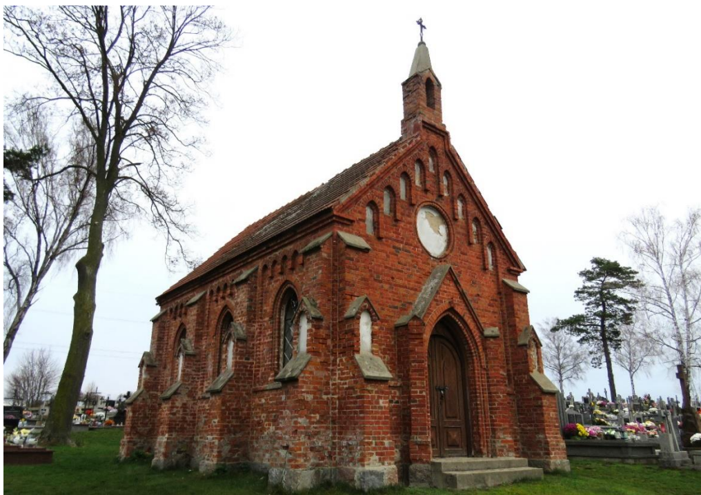
Kaplica cmentarna z 1905 r. na cmentarzu parafialnym w Puchałach

Na terenie gminy Łomża ochroną prawną objętych jest pięć cmentarzy wojennych, w tym cztery z czasów I wojny światowej i jeden z czasów II wojny światowej.