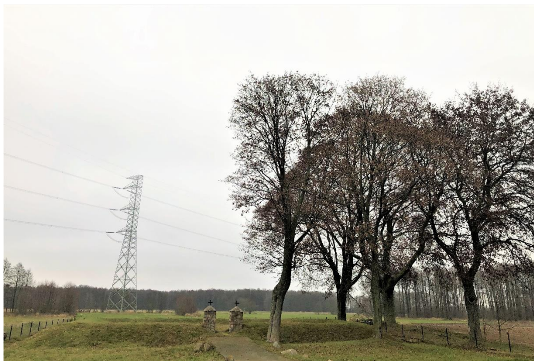
Cmentarz wojenny z czasów I wojny światowej w Gaci