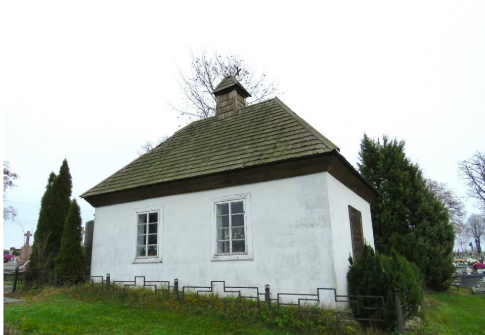
Kaplica cmentarna z 2. ćwierci XIX w. na cmentarzu parafialnym w Puchałach